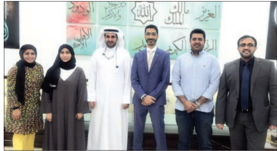
أعضاء مجلس إدارة الجمعية الطبية الجديد