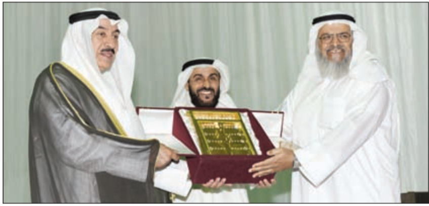
الفريق م. فهد الأمير مكرماً أحد الحضور

أقيم في مركز تنمية المجتمع بمنطقة العيون برعاية وحضور محافظ الجهراء الفريق م. فهد الأمير الملتقى الصحي التوعوي بعنوان «صحتك غاية» للوقاية من أمراض السمنة بالتعاون مع جمعية صندوق إعانة المرضى ووزارتي الشؤون والصحة والذي يناقش أخطار السمنة وكيفية الوقاية منها حيث تضمن البرنامج محاضرات لعدد من الاستشاريين والأخصائيين وكذلك معرض لأنواع التغذية الصحية. وأعرب المحافظ الأمير عن شكره وتقديره للقائمين على الملتقى الصحي لما لمس من حسن تنظيم، مؤكداً أن مثل هذه اللقاءات تسهم في النهوض بالصحة العامة ونشرها وتعزيزها