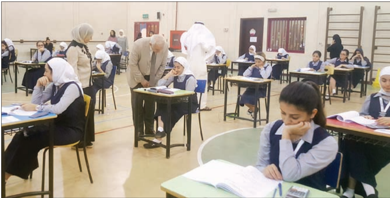
وزير التربية د. بدر العيسى لدى تفقده إحدى لجان امتحانات الثانوية أمس

قال وزير التربية وزير التعليم العالي د. بدر العيسى إن حالات الحرمان من اختبارات الثانوية العامة التي تجري حالياً بلغت 200 حالة، مبيناً أن الاختبارات شهدت طرقاتاً مبتكرة في حالات الغش أبرزها السماعات الصغيرة، وتسعى الوزارة جاهدة إلى طرق حديثة للغش والوسائل المستخدمة، مشيراً إلى أنه قد تكون هناك حالات لم يتم اكتشافها حتى الآن إلا أن الجهود تبذل لرصد أي طرق مبتكرة يقدم عليها الطلبة وسنكون لهم بالمرصاد.