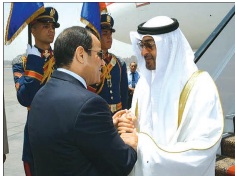
الرئيس المصري عبدالفتاح السيسي مستقبلا صاحب السمو الشيخ محمد بن زايد آل نهيان ولي عهد أبوظبي نائب القائد الأعلى للقوات المسلحة في القاهرة أمس

القاهرة أ.ش.: استقبل الرئيس المصري عبدالفتاح السيسي في القاهرة أمس صاحب السمو الشيخ محمد بن زايد آل نهيان ولي عهد أبوظبي نائب القائد الأعلى للقوات المسلحة. وصرح المتحدث الرسمي باسم رئاسة الجمهورية السفير علاء يوسف بأن الرئيس السيسي رحب بولي عهد أبوظبي، مشيدا بالمواقف المشرفة التي تتخذها الإمارات العربية المتحدة لدعم مصر ومساندة إرادته شعبيها تحت القيادة الحكيمة للشيخ خليفة بن زايد آل نهيان رئيس الدولة. من جانبه، أعرب صاحب السمو الشيخ محمد بن زايد عن سعادته بزيارة مصر، مقدما التعازي بضحاياها حادث تحطم طائرة مصر للطيران، مؤكدا تضامن بلاده مع مصر ومساندتها في مثل تلك اللحظات المؤلمة. وأكد الشيخ محمد بن زايد أن مصر تعد ركيزة لاستقرار وصماما للأمان في منطقة الشرق الأوسط، بما تمثله من ثقل استراتيجي وأمني في المنطقة.