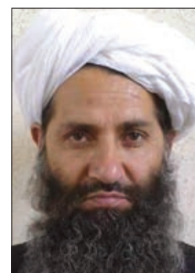
هبة الله اخوند زاده

كابول - وكالات: أكدت حركة طالبان الأفغانية رسمياً أمس مقتل زعيمها السابق الملا اختر منصور وتعيين الملا هبة الله اخوند زاده خلفاً له. وهبة الله البالغ من العمر 50 عاماً هو رجل دين معروف في أوساط طالبان، وكان بمنزلة اليد اليمنى للملا منصور، وتولى مسؤوليات في المحاكم الشرعية إبان فترة حكم طالبان لأفغانستان. ويرى مراقبون أن زعيم طالبان الجديد ليست لديه نية في استئناف مفاوضات السلام مع الحكومة الأفغانية والتي جمدت في عهد سلفه. التفاصيل ص 42