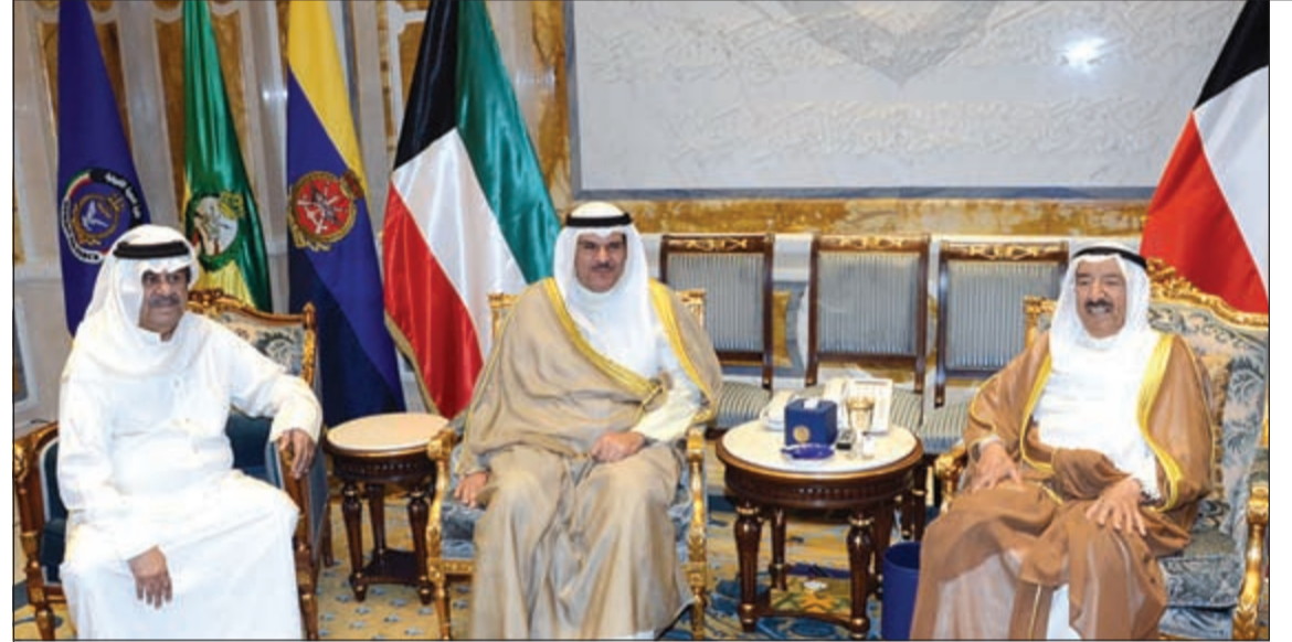
صاحب السمو الامير الشيخ صباح الاحمد مستقبلاً الشيخ سلمان الحمد والفنان عبدالحسين عبدالرضا

علمت «الأنباء» ان مجلس الوزراء وجه نائب رئيس الوزراء ووزير الداخلية الشيخ محمد الخالد لاستعجال تنفيذ قرار المجلس الاستعانة بشركة امن متخصصة لتأمين مطار الكويت من خلال التعاقد المباشر. وكشفت مصادر أمنية رفيعة في تصريحات خاصة لـ «الأنباء» ان وزارة