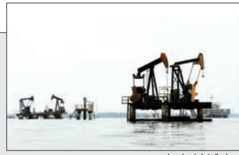
أسعار النفط في ازدياد

النفط يحوم قرب 50 دولاراً.. والتجميد انتهى بسبب تعطل الإمدادات وانتعاش الطلب 41