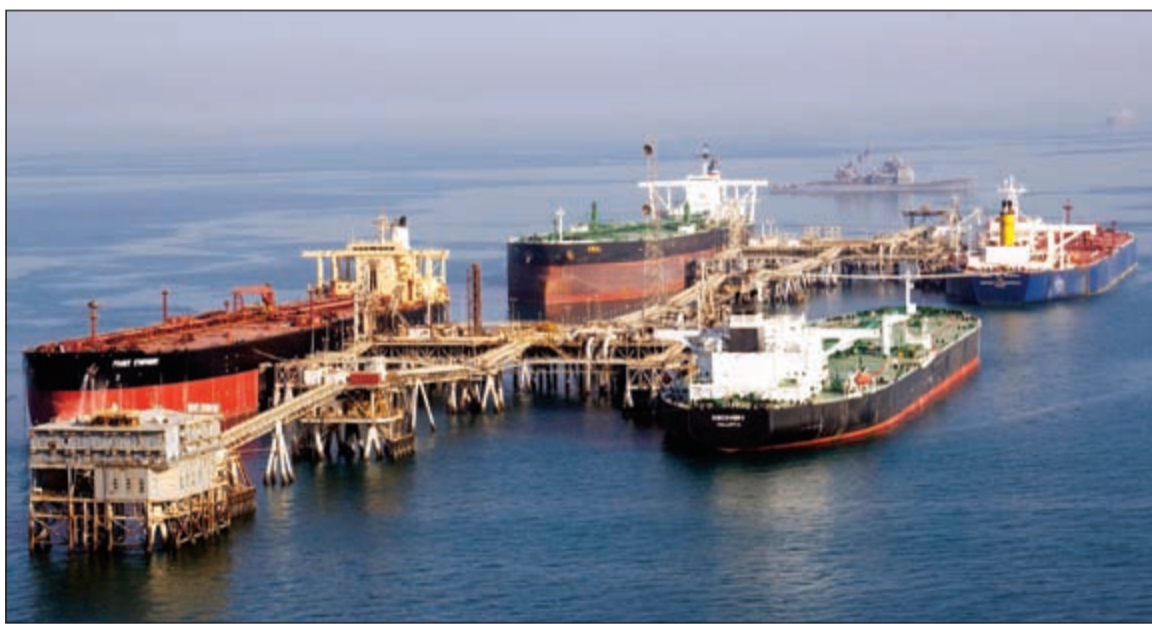
سداد الديون بالنفط معوق للدول الفقيرة المنتجة للخام

رويترز: وجدت الدول الفقيرة المنتجة للنفط التي قبلت قروضاً على أن تسدها نفطاً عندما كانت الأسعار مرتفعة أن عليها أن تشحن 3 أمثال الكميات التي كانت تتوقعها للوفاء بمواعيد السداد بعد انخفاض الأسعار.