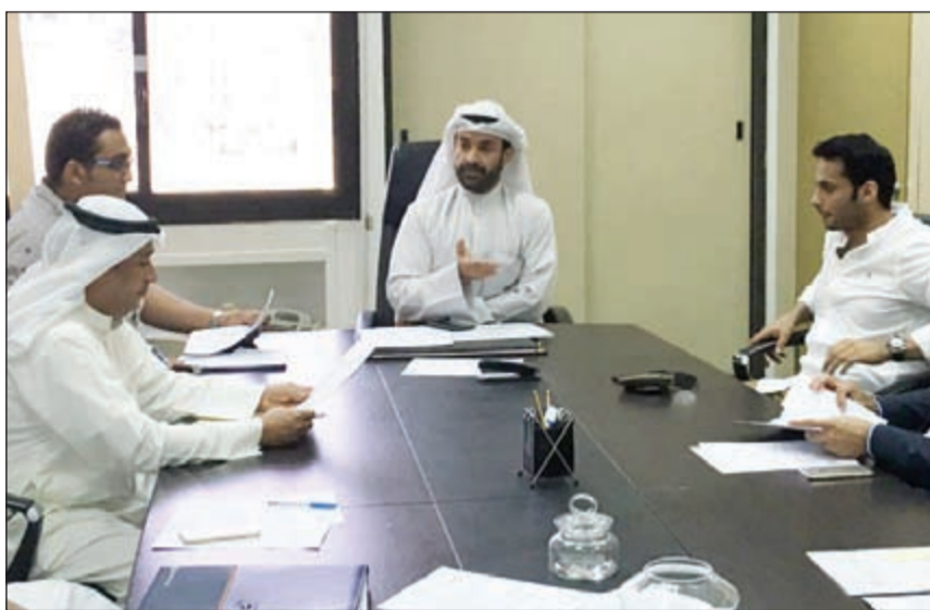
طلال الصباح يترأس الجمعية العمومية في وزارة التجارة أمس

ووافقت الجمعية العمومية العادية على كل بنود جدول الأعمال والتي كان أهمها توزيع أسهم منحة بنسبة 10٪ من رأس المال 10 أسهم لكل 100 سهم عن عام 2015، في حين تم تأجيل الجمعية العمومية غير العادية لعدم اكتمال النصاب القانوني.