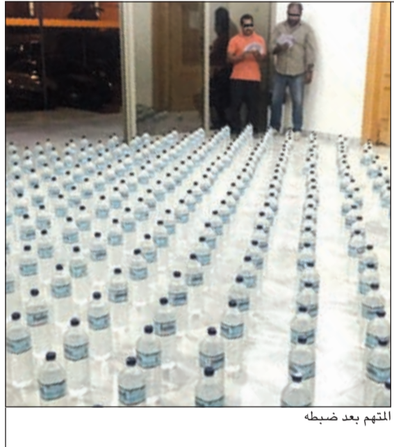
المتهم بعد ضبطه

والسروال يتمشى بالسطح فقام بقتل الباب وأبلغ الشرطة، فحضر رجال الأمن والقوا القبض عليه واحالوه إلى المخفر واعترف بأنه على علاقة بخادمة المواطن وهي