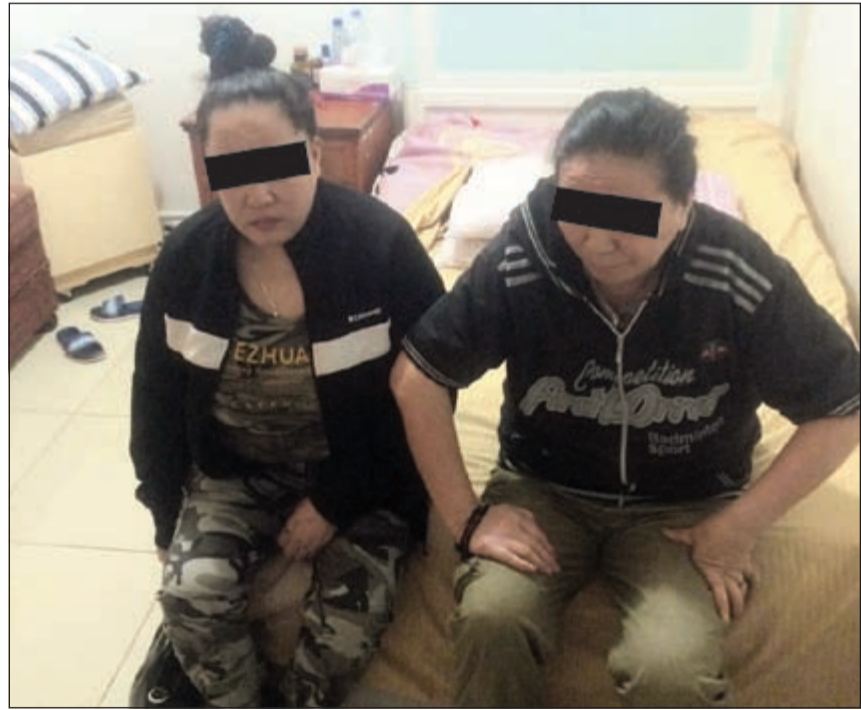
الوافدين بعد ضبطهما