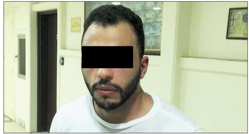
المتهم بعد ضبطه

ومن جانبها ناشدت الإدارة العامة للعلاقات والإعلام الأمني المواطنين والمقيمين ألا يقدموا التبرعات إلا من خلال اللجان والهيئات الخاصة المعتمدة من قبل الدولة، لضمان وصول التبرعات لاحتياجها.