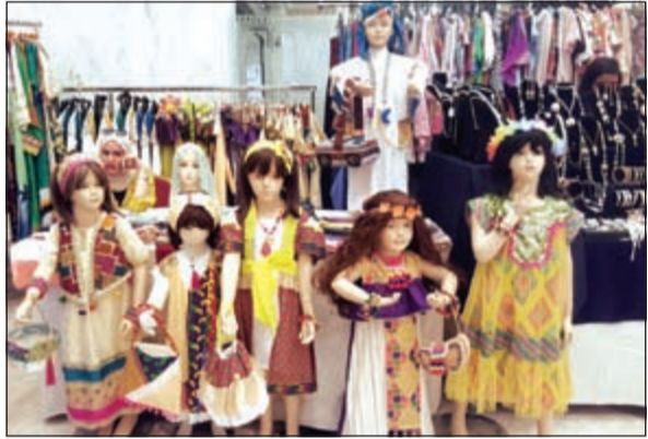
أزياء شعبية لشهر رمضان

أكدت رئيسة لجنة شؤون المرأة التابعة لمجلس الوزراء الشيخة لطيفة الفهد حرصها على دعم الشابات صاحبات المشاريع الصغيرة، مشددة على دعمها المتواصل للجمعية التطوعية النسائية التي ترأسها ونشاطاتها التي تقدم المرأة وتحاول بشتى الطرق تطويرها وصقل مهاراتها من خلال النشاطات المتنوعة التي تقيمها على مدار العام. كلام الفهد جاء خلال افتتاح الجمعية التطوعية النسائية لخدمة وتنمية المجتمع لسوقها الخيري السنوي في نسخته الـ 36 ضمن استعداداتها لاستقبال شهر رمضان المبارك وذلك بمشاركة أكثر من 250 امرأة كويتية بهدف دعم المرأة ومساندتها.