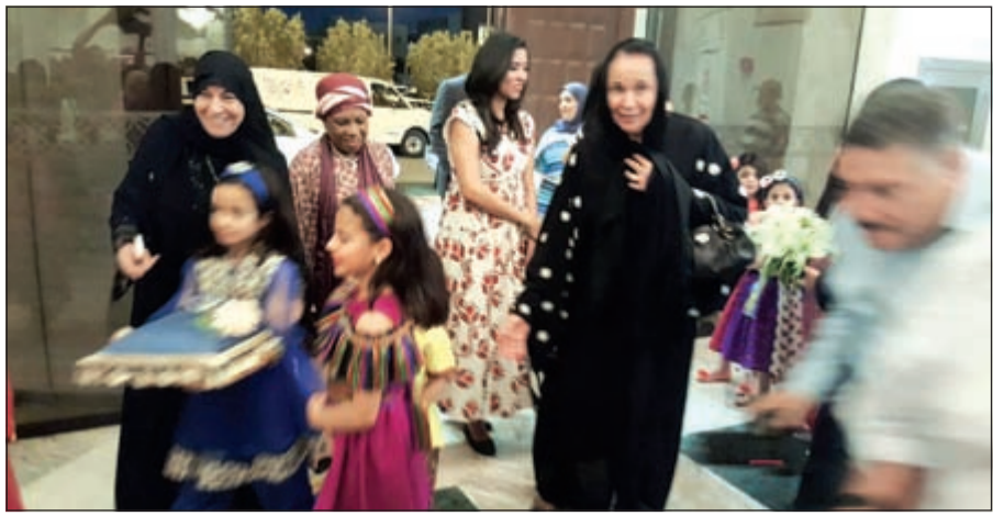
الشيخة لطيفة الفهد خلال جولة في السوق الخيري