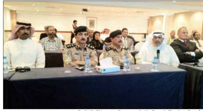
م.أحمد الحصان واللواء عبدالله المهنا وعدد من الحضور خلال افتتاح الجسر

المشروع الكبير والذي سيتم تنفيذه قريبا والذي من خلاله سيتم إلغاء كل الاستدارات العكسية الأرضية الموجودة على طريق النويصيب للتقليل بصورة كبيرة من الحوادث التي تحدث على هذا الطريق الهام والحيوي. بدوره، قال وكيل المساعد لقطاع شؤون المرور في وزارة الداخلية اللواء عبدالله المهنا بكل تفاصيل