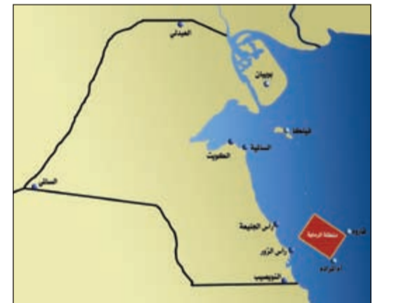
خريطة توضح موقع الرماية

أعلنت مديرية التوجيه المعنوي والعلاقات العامة بالجيش للمواطنين والمقيمين من مرتادي البحر من هواة الصيد والتنزه، عن قيام القوة البحرية بتنفيذ رماية تدريبية بالذخيرة الحية، وذلك اليوم وغداً من الساعة السابعة صباحاً حتى الخامسة مساءً، في ميدان الرماية البحري على مسافة 16,5 ميلاً بحرياً شرق رأس الجليعة امتداداً لجزيرة قاروه، وبمسافة 6 أميال بحرية شرق رأس الزور امتداداً إلى جزيرة أم المرادم. وتهيب مديرية التوجيه المعنوي والعلاقات العامة، بجميع المواطنين والمقيمين من مرتادي البحر، إلى عدم الاقتراب من المنطقة المذكورة خلال الفترة المعلنّة، حرصاً منها على سلامة الجميع.