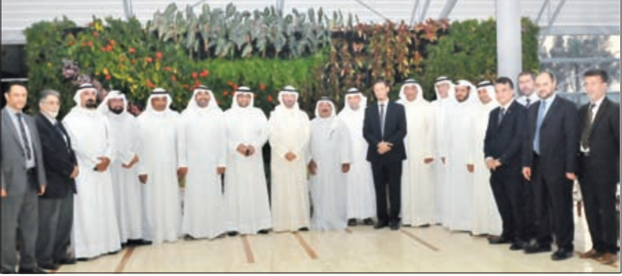
الشيخ ناصر صباح الأحمد مستقبلاً أعضاء مخيم الأمل الطبي الجراحي

استقبل وزير شؤون الديوان الأميري الشيخ ناصر صباح الأحمد، عضو مجلس إدارة جمعية العون المباشر فهد الحساوي يرافقه أعضاء مخيم الأمل الطبي الجراحي السابع الذي أقيم في جمهورية السودان خلال الفترة من 13 - 20 مايو الجاري والذي يضم مجموعة من الأطباء والاستشاريين من عدة تخصصات بهدف إجراء العمليات الجراحية والخدمات العلاجية المجانية لأهالي الخرطوم وأم درمان. ورحب وزير شؤون الديوان الأميري بجهد الفريق الطبي وأشاد بالمهمة الإنسانية التي قام بها والتي تعد ترسخاً لثقافة العمل التطوعي والعطاء الإنساني المهم.