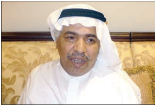
عبد الله الحجيل

تحت رعاية وحضور وزير الإعلام وزير الدولة لشؤون الشباب ورئيس المجلس الوطني للثقافة والفنون والآداب سلمان الحمود تنطلق 26 الجاري فعاليات المهرجان العربي لمسرح الطفل الرابع على مسرح الدسمية وتستمر حتى 4 يونيو المقبل. وصرح الأمين المساعد لقطاع الفنون والمسرح الوطني ورئيس اللجنة التحضيرية للمهرجان العربي لمسرح الطفل الرابع د.بدر الدويش بأنه تم اختيار الفنان عبدالله الحجيل كشخصية للمهرجان نظرا لجهده في مسلسل «أفنج يا سمسم»، وبشترك في هذا المهرجان أربع دول عربية هي الجمهورية اللبنانية، جمهورية مصر العربية، دولة الإمارات العربية المتحدة، الجمهورية التونسية، كما يشترك من الكويت فرقة الجيل الواعي، فرقة المسرح العربي، جمعية الإبداع