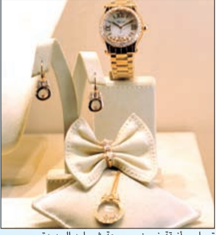
تصاميم أنيقة ضمن مجموعة شوبارد الجديدة