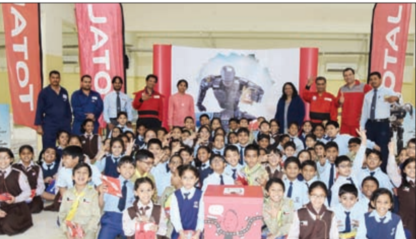
لقطة تذكارية للمشاركين في الحملة التوعوية