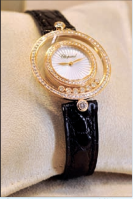
من التشكيلة الجديدة (قاسم باشا)

خصصت هذه المرة للسيدات، لتشكل ساعة Happy Diamonds العصرية حلية نفيسة من المجوهرات تشع بسحر الماضي وألق الحاضر. تحيط بمينا الساعة أحجار الألماس المثبتة بمخالب التثبيت لتبرز منحنيات المينا الأنيقة، بينما تنطلق أحجار الألماس المتحركة لتتراقص بحرية فوق خلفية لؤلؤية بيضاء. ازداد عدد هذه الأحجار المتراقصة كما ظهرت بأحجام متفاوتة، إلا أنها بالإجمال أكبر حجماً من سابقتها. وكان ذلك بغية إلقاء المزيد من الضوء على حركاتها المتراقصة وإبراز الزخم الذي يتجلى بترصيع الساعة بكل هذا العدد من أحجار الألماس. وداخل هذا المسرح الذي تؤدي عليه أحجار الألماس رقصاتها الرشيقية يبرز أيضاً مينا صغيراً تُوَظِرُه أحجار الألماس وترتكز عليه عقارب الساعة وهي تطوف عبر مشهد هذا المسرح الأخاذ. هذه الساعة الفريدة من نوعها موجودة أيضاً بمينا دائري الشكل.