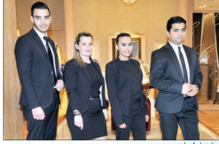
فريق عمل شوبارد