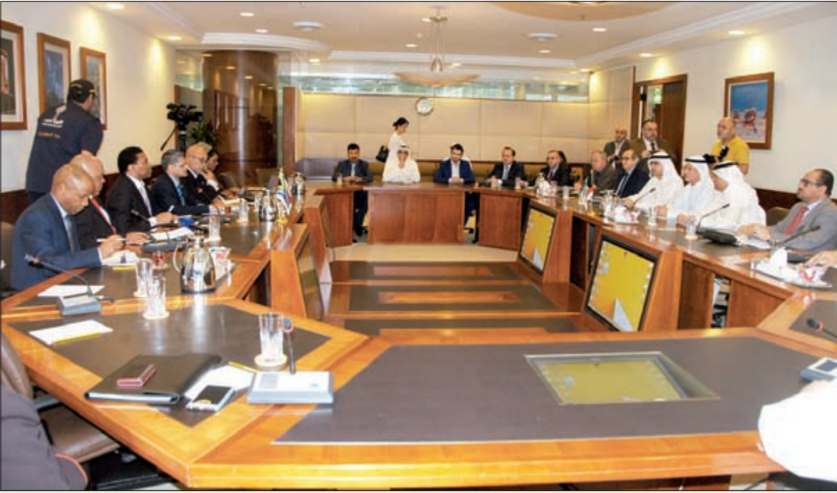
جانب من اجتماع وفد جنوب أفريقيا مع الجانب الكويتي في غرفة التجارة أمس (محمد هاشم)