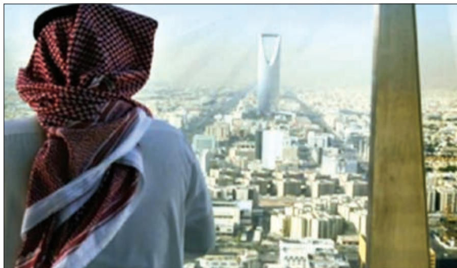
السعودية تصدرت إجمالي إصدارات سوق السندات والصكوك الخليجية بواقع 15 إصداراً