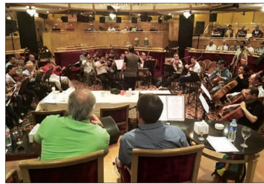
جانب من البروقات (شريف عديريه)

إلى جانب عدة اغنيات من إبداعاته الغنائية منها أغنيات «غلمتها، مسيره يرد، يعلن عليها الحب، ليالي نجد، يا ما شاء الله، نجمي ونجمك، ما أجملك، وحشني زمانك، خوافن أنا حبيبي، شخبارك، هلا بالطيب الغالي». وعقد مساء أمس «الأحد» مؤتمر صحافي لـ «فنان العرب» محمد عبده بحضور رئيس شركة «روتانا» سالم الهندي ونخبة من رجال الإعلام السعودي والمصري، وذلك للإعلان عن إطلاق الألبوم الجديد «عالي السكوت»، الذي يطرح بالأسواق قريباً. هذا وقد بدأت ترتيبات حفل «فنان العرب» في دار الأوبرا المصرية منذ عدة أشهر، وأشرف عليها عبده بنفسه، ويحضر الحفل نخبة من نجوم الفن والإعلام وأعضاء السلك الديبلماتي في مصر، ويتم تسجيله تلفزيونياً ليعرض لاحقاً عبر عدد من المحطات الفضائية.