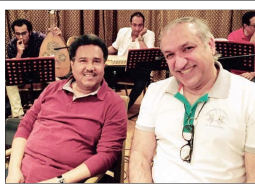
فنان العرب، محمد عبده ورئيس «روتانا» سالم الهندي وابتسامة لعنسة «الأنباء»

تستعد الفنانة السورية أمل عرفة للانطلاق بتصوير أحد أدوار البطولة بمسلسل «الرباوص» للكاتب سعيد حناوي وإخراج إياد نحاس ومن إنتاج شركتي النحاس وزوى أرت. ونشرت تقارير صحافية أن أمل عرفة تؤدي في المسلسل شخصية «هيام» وهي زوجة «نزار» الذي يؤدي دوره عماد شلق، حيث يتهمها زوجها بالخيانة ويجعلها تعيش حياة بائسة إلى أن يوصلها للانتحار بعد ولادة ابنتها «ميادة» التي تؤدي دورها الفنانة كندة حنا، وبعد مرور زمن يكتشف «نزار» أن «هيام» لم تخنّه فتظهر له على شكل شبح متخف يومياً، تطلبه