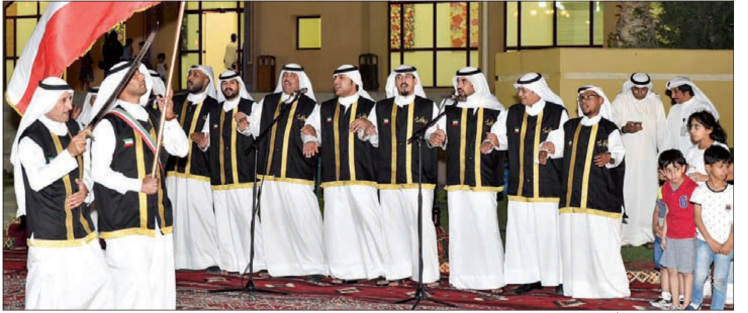
فرقة الجبراء للفنون الشعبية أثناء وصلتها