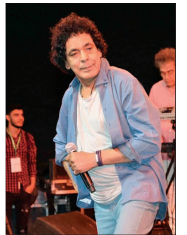
محمد منير.. «حدوتة مصرية»

بدأ «الكينغ» محمد منير حفله الصحاب من جمهوره في ملعب الهوكي في ستاد