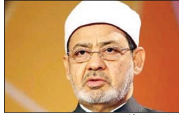
شيخ الأزهر د. أحمد الطيب

وكان مغردون قد تناقلوا على «تويتر» صورة لسؤال ورد في امتحان اللغة العربية