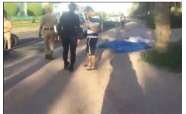
من موقع الحادث الاليم