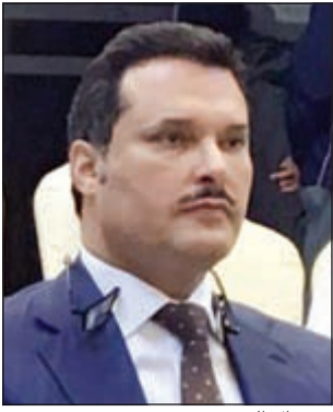
د. جمال الحربي

يحل الوكيل المساعد لشؤون الخدمات الطبية المساندة بوزارة الصحة د.جمال الحربي ضيفاً على «ألو الأبناء» اليوم الأحد 22 الجاري من الساعة 6 إلى الساعة 7 مساءً، وذلك للحديث عن الخطط المستقبلية وآخر المستجدات للقطاع والجديد في مجالات الطوارئ الطبية والمختبرات والعلاج الطبيعي وبنك الدم والتمريض. وسيكون التواصل مع الضيف على رقم: 22272888.