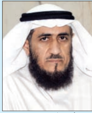
م.فريد أسد عمادي

يحل وكيل وزارة الأوقاف والشؤون الإسلامية م.فريد أسد عمادي ضيفاً على قراء «الأنباء» غدا الإثنين 23 الجاري من الساعة 6 – 8 مساءً. وسيتناول اللقاء استعدادات وزارة الأوقاف لشهر رمضان الكريم ودور الوزارة واللجنة العليا للوساطة في مكافحة التطرف والإرهاب والأفكار الدخيلة على مجتمعنا وجهودهما في نشر الفكر الإسلامي الوسطي. ويمكن للقراء الأعزاء التواصل مع الضيف على رقم «الأنباء»: 22272888.