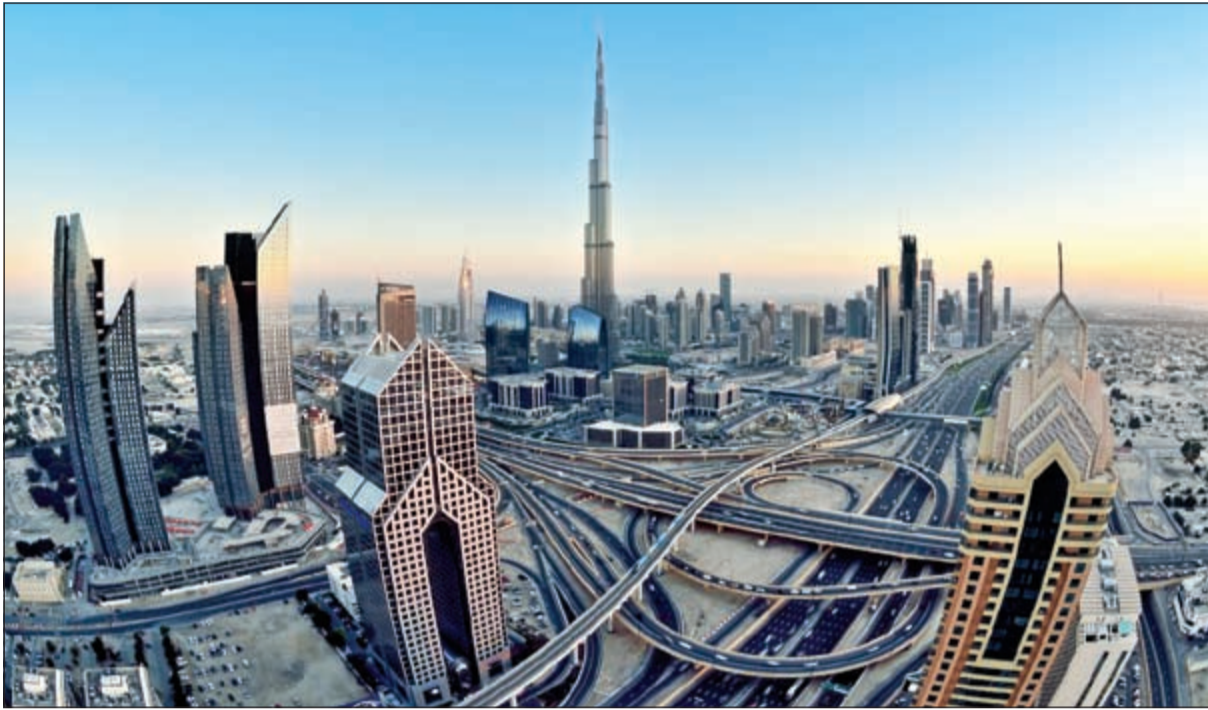
انتعاش قوي ينتظر دول الخليج في 2018 مع توقعات بارتفاع أسعار النفط إلى 60 دولارا