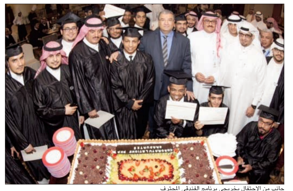
جانب من الاحتفال بخريجي برنامج الفندقي المحترف

طرح فندق موفنبيك الكويت بالمنطقة الحرة باقة عائلية للتمتع بخدمات حمام السباحة بمناسبة قدوم فصل الصيف، وهي عبارة عن مجموعة قسائم عائلية تشمل على 20 قسيمة للكبار و20 قسيمة للأطفال شاملة رسوم دخول حمام السباحة ووجبة خفيفة. وكالعادة بداية كل صيف قامت إدارة فندق موفنبيك الكويت بإعطاء إشارة البدء بإعادة افتتاح اللاجون بار المطل على أطراف حمام السباحة والذي يتميز بقائمة الطعام والمشروبات التي تتناسب مع الأجواء الصيفية وجود وسائل الترفيه المتنوعة. ليس هذا كل شيء، ففي الصيف يوفر الفندق مزيجاً من الأطعمة والمذاقات الفريدة تتلون بتلون مطاعمه المتنوعة، فبدية من مطعم بايز الذي يقدم ما لا وطاب من الأطعمة العالمية، مروراً بمطعم كاتس الذي يقدم أشهى اللحوم في الكويت، وصولاً إلى مطعم ال دانتلي الذي يقدم