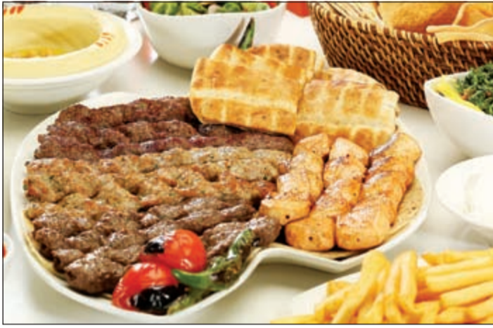
أشهى الأطباق من ميس الغانم