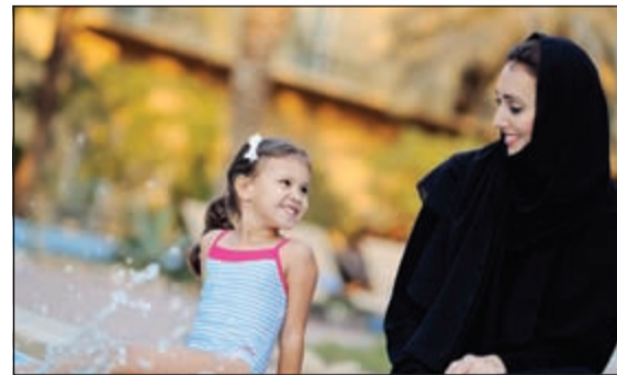
أجواء صيفية عائلية متميزة في «موفنبيك المنطقة الحرة»

هذا العام فهو العنوان الأمثل لمستوى رائع من الخدمة تنعم فيه بالرفاهية والراحة والاستجمام بعيداً عن هموم العمل والحياة اليومية وخاصة بعد تجديد الغرف كليا والتجديدات الأخيرة للممام والأعمال واحتفالات الزواج وأعياد الميلاد، ويقدم فندق موفنبيك الكويت قاعة راكنا 2 للاجتماعات، المكان الأمثل لتنظيم الاجتماعات، من جهته، قال مدير التسويق والعلاقات العامة السيد العاصي: ليس هناك أفضل من فندق موفنبيك الكويت لقضاء عطلة الصيف