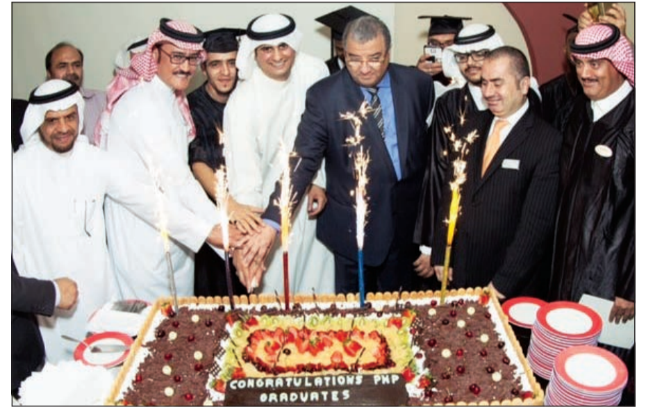
مشاركة بقطع كيكية حفل تخريج (الفندقي المحترف) في موفنبيك

احتفلت شركة فنادق ومنتجعات موفنبيك في المملكة العربية السعودية بتخريج 200 موظف من برنامج الفندقي المحترف التي صممتها الشركة لموظفيها. والبرنامج الذي تم إطلاقه في مايو 2015 يتيح لموظفي موفنبيك فرصة كسب المزيد من المعرفة في قطاع الضيافة والحصول على الخبرة في قطاع السياحة السريع النمو في المملكة العربية السعودية. ويتكون برنامج الفندقي المحترف في المملكة العربية السعودية من 8 مراحل من الدروس يندمج إكمالها للتخرج، وتغطي الدروس عدة مواضيع كالفندقي المحترف، والخدمة العالية المستوى، وكتابة خطط العمل، وأهمية إدارة الوقت، والعمل الجماعي والتنوع الثقافي. وقال أندرياس ماتنولر، رئيس العمليات لدى شركة فنادق ومنتجعات موفنبيك في الشرق الأوسط وجنوب آسيا، «برنامج الفندقي المحترف