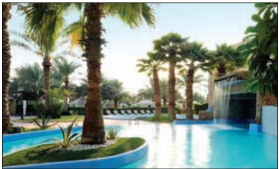
حمام السباحة لقضاء أمتع الأوقات