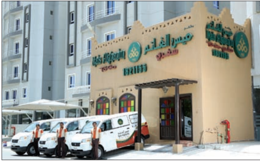
مطعم ميس الغانم سفري

لمزيد من المعلومات يمكنكم الاتصال مباشرة على الرقم الساخن أو عن طريق موقع طلبات كما يمكنكم زيارة الموقع الإلكتروني لمجموعة مطاعم ميس الغانم لمعرفة خريطة الموقع الجديد.