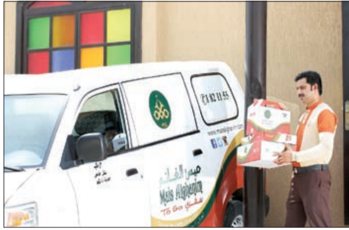
خدمة التوصيل المميزة من ميس الغانم