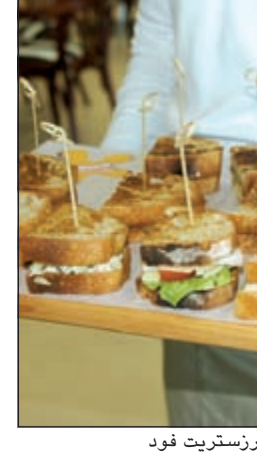
هامبرغر شهى في برانرزستريت فود