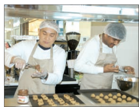
إعداد أشهى المأكولات والحلويات

«تشوي جوي» و«الست» و«برانرز ستريت فود» أرقى المطاعم