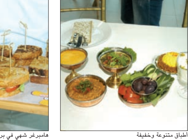
أطباق متنوعة وخفيفة