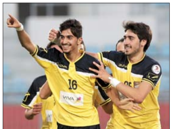
الكندري، معظم الأندية لن تستطع تسجيل 40 لاعبا

وحول استعدادات الفريق للموسم الجديد، قال: لم