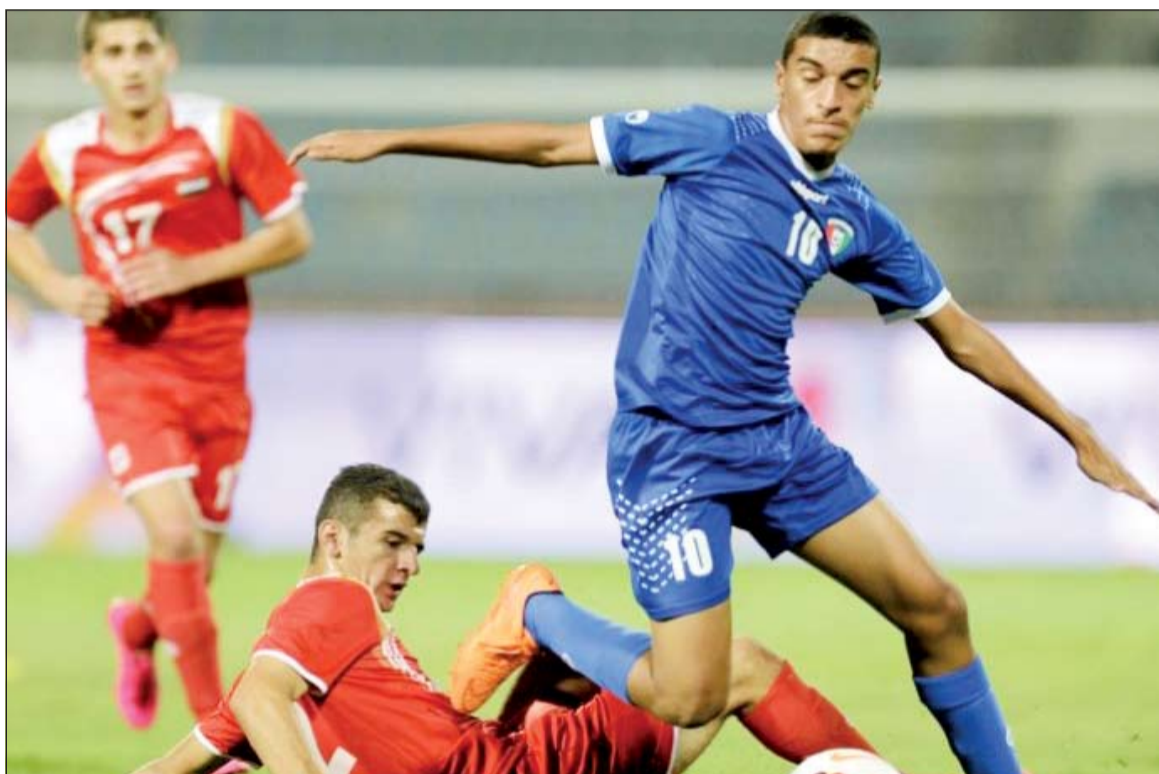
أزرق الناشئين فقد رسمياً فرصة المشاركة في كأس آسيا.

وكان الأزرق قد تاهل رسمياً الى النهائي المقرر اقامته في نيودلهي بعد ان تصدر مجموعته السادسة عن جدارة واستحقاق، ويأتي استبعاد الأزرق بسبب قرار الإيقاف المفروض على الكرة الكويتية.