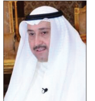
الشيخ فيصل الحمود

أطل محافظ الفروانية الشيخ فيصل الحمود في التاسعة من مساء أمس الاول في برنامج شخطة قلم (الحلقة الأولى) على قناة «الكويت بلس»، حيث استضافه الإعلامي محمد البرجس. وتحدث الشيخ فيصل الحمود بداية عن عمله الرسمي بدءا من مكتب الأمير الوالد المغفور له بإذن الله تعالى الشيخ سعد العبدالله عندما كان وليا للعهد وانتهاء بمنصبه محافظ للفروانية مروراً بمنصبه سفيرا في سلطنة عمان والملكة الأردنية الهاشمية وديوان وزارة الخارجية.