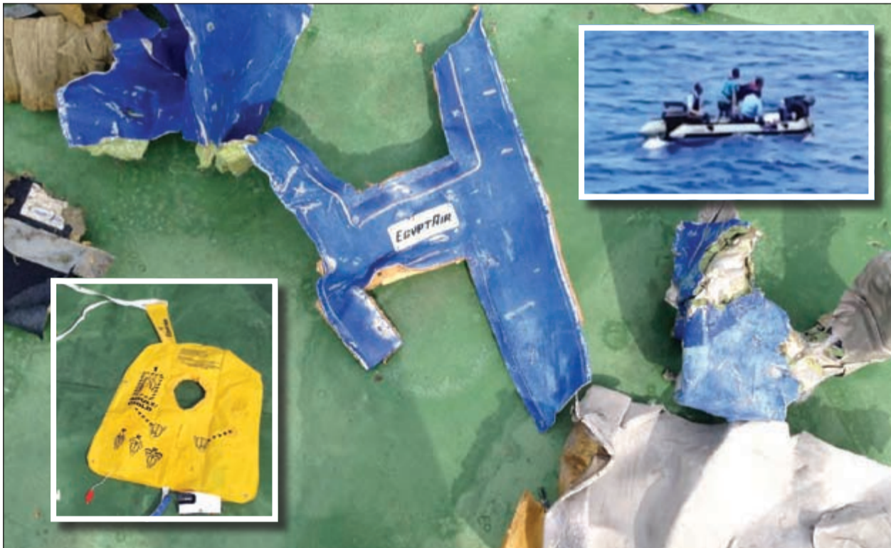
قطع من حطام الطائرة المصرية المنكوبة ومتعلقات بعض الركاب وسترة نجاة نشرها المتحدث العسكري للقوات المسلحة المصرية على صفحته على الفيسبوك وفي الإطار جانب من عملية البحث عن الضحايا