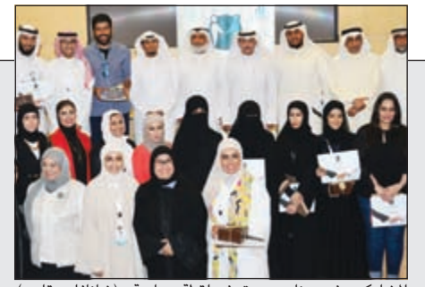
الشاركون في برنامج مودة في لقطه جماعية (شانا فاس قاسم)

جنبلاط: حرص تاريخي من حكام الكويت على أمن واستقرار لبنان 15