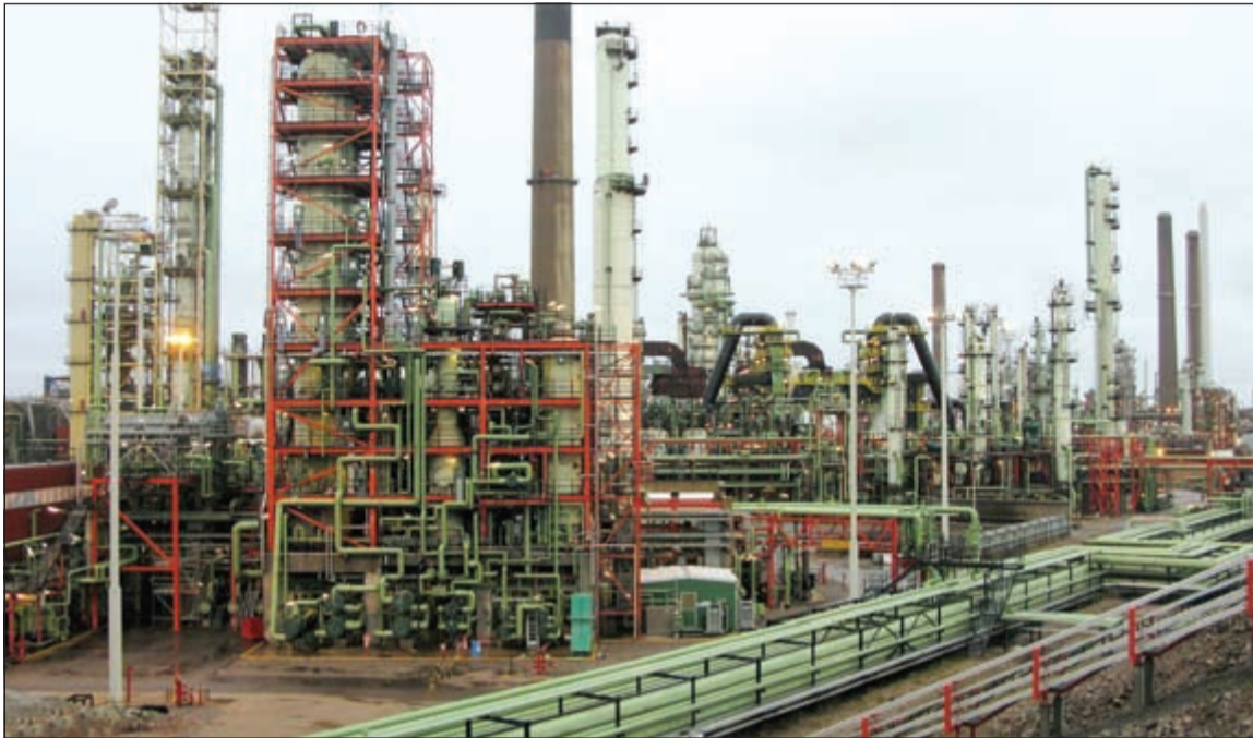
أسعار النفط تتجاهل إعلان الشركات الأميركية العاملة بالنفط الصخري إفلاسها (رويترز)

ارتفعت أسعار النفط أمس، وسط اضطرابات في نيجيريا وإعلان شركات للنفط الصخري إفلاسها في الولايات المتحدة، فضلا عن أزمة في فنزويلا، وهي جميعها عوامل ساهمت في الحد من الإمدادات.