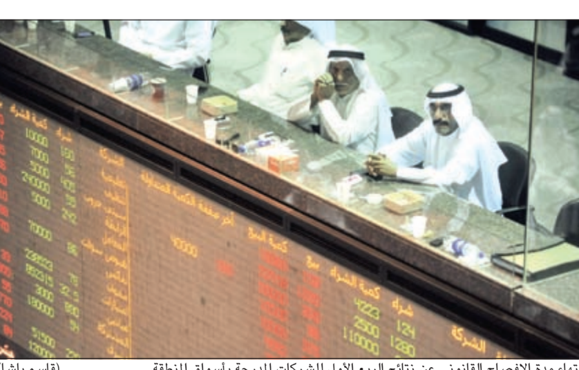
انتهاء مدة الإفصاح القانوني عن نتائج الربع الأول للشركات المدرجة بأسواق المنطقة (قاسم باشا)

الاستثمارية إلى إعادة النظر في مراكزهم المالية تجاه أسهم البنوك بالتحديد. وأضاف ياسين: أن هذه النتائج كانت أحد أسباب التذبذب القوي الذي شهدته الأسواق طيلة الجلسات الماضية، موضحا أنها دفعت الكثير من المستثمرين إلى عدم توسيع المراكز بالأسهم، الأمر الذي كان سببا رئيسيا في تدني مستوياتها السيولة بشكل لافت.