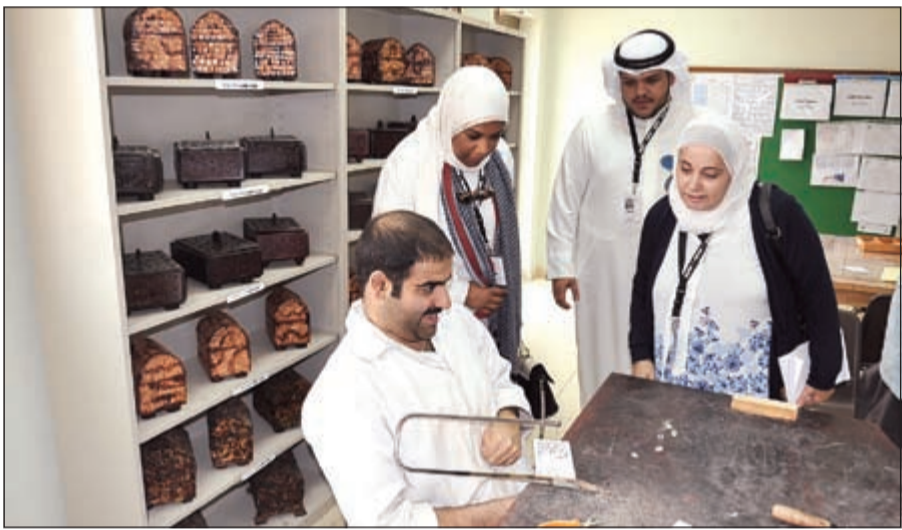
أحدى ورش النجارة الملحقة بالمركز