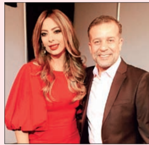
ريم أرجمه مع النجم المصري شريف منير

● أخذها على محمل الضحك، ولا أعتقد أن هناك أحدا لا يعلم أنني متزوجة.