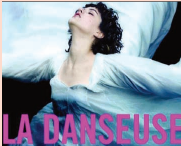
ملصق فيلم LA DANSEUSE

كان - سي. إن. إن. كل خطوة من خطوات صناعة فيلم سينمائي تتطلب مقدارا كبيرا من الإبداع. فمن اختيار خزانة ملابس الفنانين أثناء التصوير، إلى اختيار الموسيقى في المونتاج، مروراً بتقطيع دعاية الفيلم القصيرة، يتم توظيف الكثير من الجهود الإبداعية للتفكير في أدق التفاصيل، لكن، يوجد عمل فني يختصر في نظرة واحدة قصة الفيلم، وشخصياته، والجانب الفني منه، وعلى الرغم من بساطته، إلا أنه يتطلب الكثير من الجهد والابتكار. إنه ملصق الفيلم الدعائي، الذي رغم كونه عملاً ثنائي الأبعاد يظهر اسم الفيلم والمرح و بعض الصور أو الرسوم، إلا أنه قادر على اختصار كل المشاعر والأفكار في الفيلم بطريقة قد تفوق الدعاية بحد ذاتها وتخطف الأنظار وتبهرها. وما من مكان أفضل لمشاهدة أمثلة مميّزة للملصقات الأفلام أكثر من مهرجان «كان» السينمائي، حيث المنافسة على أشدها بين المبدعين في عالم السينما لجذب أكبر قدر من الاهتمام. من جهته أخرى، عبر أعضاء فريق تمثيل فيلم «كابيت فانتاستيك» عن سعادتهم بالمهرجان وراحوا يلتقطون سيلفي لأنفسهم بفرحة غامرة.