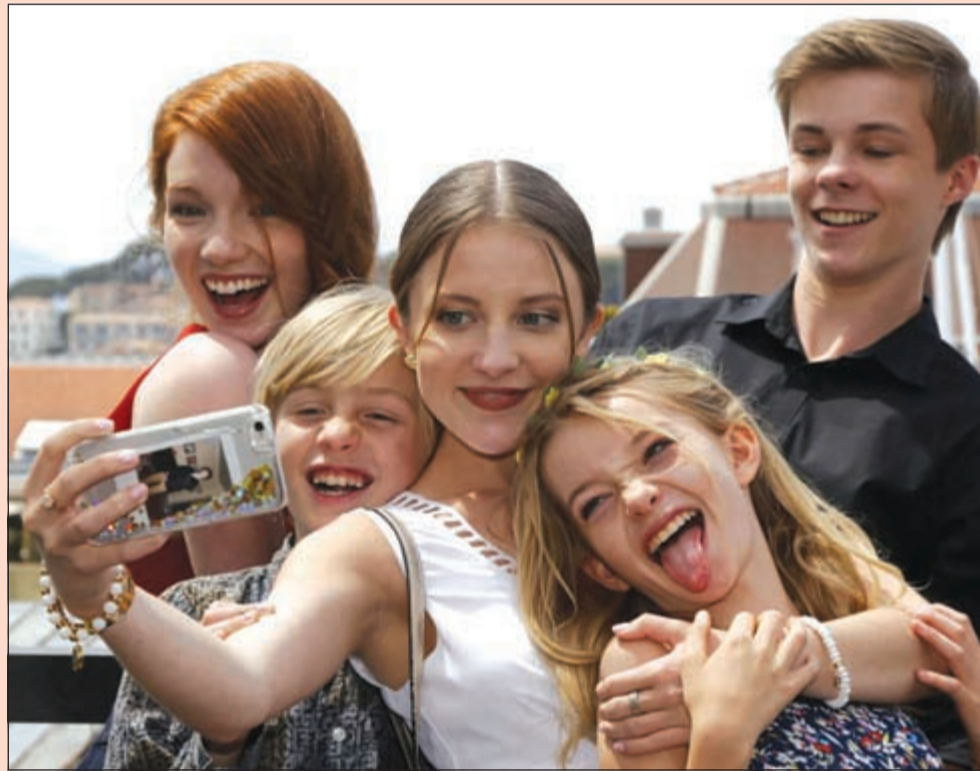
فريق التمثيل في فيلم «كابيت فانتاستيك»