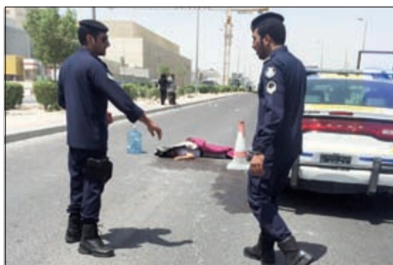
من حادث دهس الري

أغلق رجال اسناد حولي قضية ابتزاز تعرضت لها وافدة فلبينية من قبل شاب عربي كان قد ارتبط بها