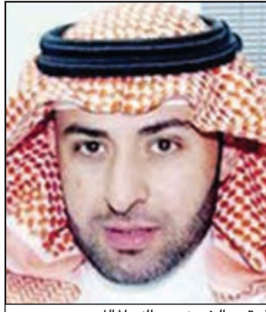
العقيد الشيخ عبدالله الملك

علمت «الانباء» من مصادر مطلعة ان محافظ الفروانية الشيخ فيصل الحمود استطاع خلال زيارته الاخيرة للمملكة الاردنية الهاشمية لتأدية احدي الواجبات الاجتماعية انهاء مشكلة مواطن كويتي نجمت عن حادث ادى لوفاة مواطن اردني، حيث تنازل ذوو الفقيد بطيب