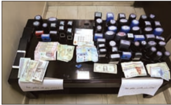
الاختام المزورة والأموال المصبوطة مع المتهمين