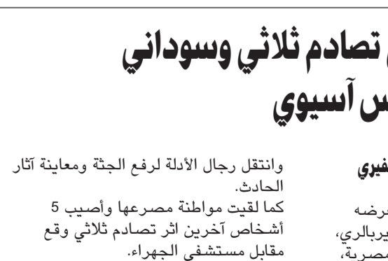
عبدالله قنيس - هاني الظفيري

وانتقل رجال الادلة لرفع الجثة ومعاينة آثار الحادث. كما لقيت مواطنة مصرعها وأصيب 5 أشخاص آخرين اثر تصادم ثلاثي وقع مقابل مستشفى الجهراء. وقال مصدر امني ان التصادم وقع بين سيارة موديل 2001 يقودها مصري وأخرى موديل 2013 بقيادة مواطن وبرفقتة طفل، أما الثالثة فكانت تقودها المتوفاة وكان يرفقتها مواطنة أخرى وأصيب جميع أطراف الحادث.