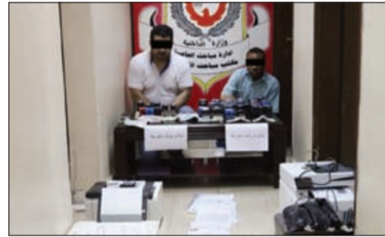
المتهمان وأمامهما المصبوبات

محلية ولاقصر مختلفة فيها يستخدمها المتهمان في التلاعب بقيمة الراتب المبينة في كشوفات الحسابات البنكية الخاصة بالمتعاملين معها. وأوضحته الإدارة أن مباحث العاصمة استدلت ذلك على أن أحد المتهمين يستخدم حديته ويتقاضى ما بين 500 و700 دينار نظير إنجاز المعاملة الواحدة. وبيئت أنه وعلى ضوء