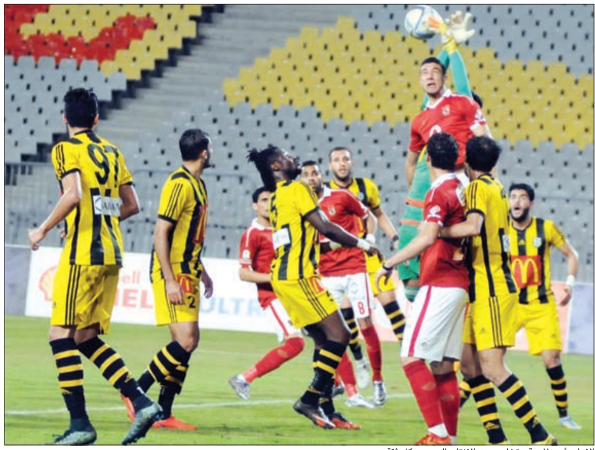
الاهلي أدى المهمة وتخلص من الانتاج الحربي بكل ثقة