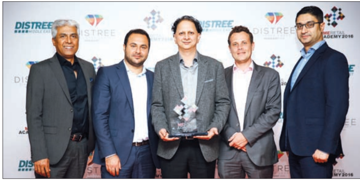
ممثلو X سايت خلال تسلمهم الجائزة

أما على الشواف فقد كان له في هذا الحفل جائزة مميزة كأفضل مسؤول تنفيذي في قطاع التجزئة في الكويت لهذا العام. وتعتبر X سايت من إلكترونيات الغانم أكبر شبكة تجزئة لمعارض الإلكترونيات في الكويت وتضم أكثر من 300 علامة تجارية عالمية. ويعتبر التسوق عند X سايت تجربة شيقة والمتعة والقيمة لكل زبانه. إضافة إلى معارض X سايت الموزعة في 18 موقعا حيويا في الكويت إضافة إلى معرضين في الرياض بالمملكة العربية السعودية أسلوبا جديدا في تعزيز التواصل بين الزوار والأجهزة الإلكترونية من خلال طريقة عرض بسيطة تتيح للزائر مشاهدة الجهاز ولمسه والتعرف إلى مزاياه مباشرة بوجود فريق من مسؤولي الخدمة المؤهلين للإجابة عن أسئلة الزوار والعملاء.