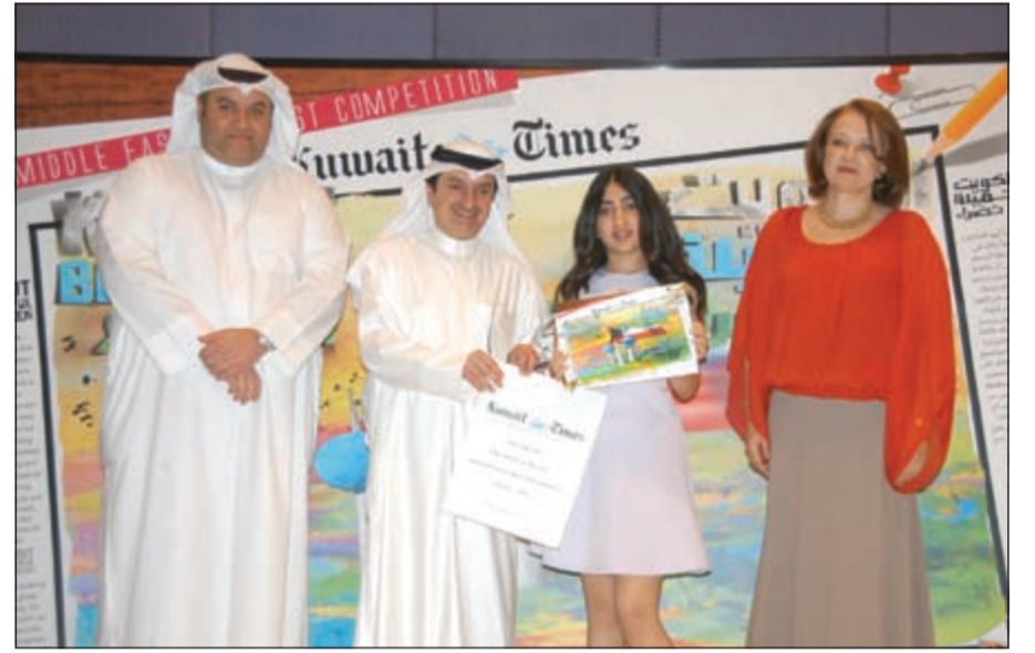
توزيع الجوائز على الطلبة الفائزين

بعرضها وإبرازها بردهات الوزارات والمستشفيات او المؤسسات والبنوك ودعمها ماديا بمبلغ معنوي تساهمون به للجهود الخيرية... وتابع: نشعر بالفخر والاعتزاز لرعاية الشيخ سلمان الحمد لهذه المسابقة ونحن نؤمن باننا احدى دعائم هذا المجتمع من الناحية الاعلامية والصحافية كما نؤمن بالتجديد كل عام بالمساهمة في توعية المجتمع بكل فئاته لدهم ورعاية ونشر الوعي والثقافة البيئية الضرورية للحفاظ على الطبيعة بعناصرها وثوراتها، فجاءت مسابقة الرسم للطلبة للمرة الحادية عشرة بالتعاون مع شركة زين الرائدة للاتصالات الراعي الرسمي وفندق الماريوت الذي يحضن حفل توزيع الجوائز بمشاركة العديد من المدارس الحكومية وذوي الاحتياجات الخاصة والأجنبية بجميع مراحلها الدراسية.