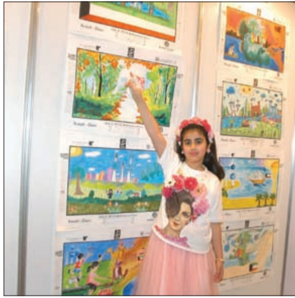
طالبة أمام لوحاتها