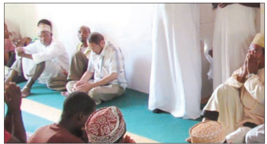
السفير جاسم الناجم خلال افتتاح أحد المساجد

المباشر في زنجبار ومتابعة تحضيرات حفل وضع حجر الأساس والذي من المقرر ان يحضره رئيس زنجبار د. علي محمد شين. من جهته، أعرب وزير الأوقاف والشؤون الإسلامية السابق في زنجبار خميس عبدالله عن شكره وتقديره للكويت أميراً وحكومة وشعباً لمساهمتهم في إقامة المشاريع الخيرية والإنسانية في زنجبار، وأشاد بدور الجمعيات الخيرية الكويتية وحرصها الدائم على تنفيذ المشاريع في أكبر عدد ممكن من القرى والمناطق في الجزيرة، وشارك في حفل الافتتاح مدير مكتب جمعية العون المباشر في زنجبار امين محمد وحشد من الأهالي.