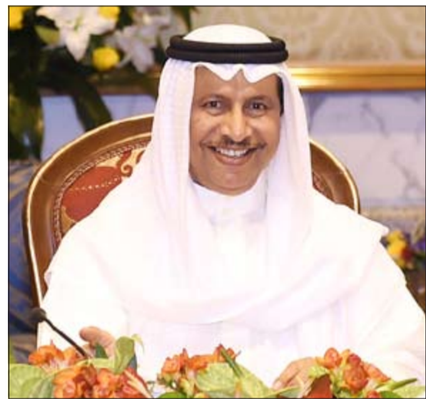
سمو رئيس الوزراء الشيخ جابر المبارك مترسلاً اجتماع المجلس الأعلى للتخطيط

ترأس سمو الشيخ جابر المبارك رئيس مجلس الوزراء ورئيس المجلس الأعلى للتخطيط والتنمية صباح أمس الاجتماع الثالث للمجلس الأعلى للتخطيط والتنمية، والذي عقد في قصر أعضاء المجلس. وقالت وزيرة الشؤون الاجتماعية والعمل ووزير الدولة لشؤون التخطيط والتنمية هند الصباح في تصريح عقب الاجتماع: إن المجلس استهل اجتماعه بالصادقة على محضر اجتماعه السابق، مضيفة أن المجلس ناقش الخطة السنوية 2018/2017 عقب مشاهدته لعرض مرئي لها، ثم قرر اعتمادها وإحالتها لمجلس الوزراء.