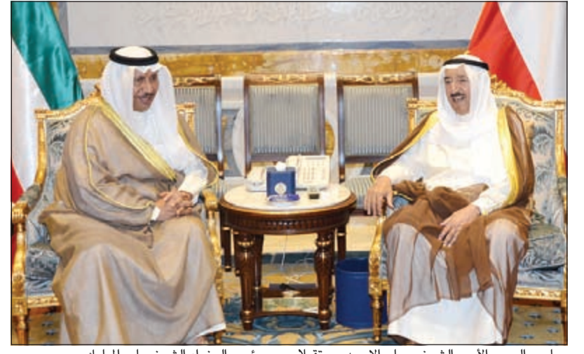
صاحب السمو الأمير الشيخ صباح الأحمد مستقبلاً سمو رئيس الوزراء الشيخ جابر المبارك