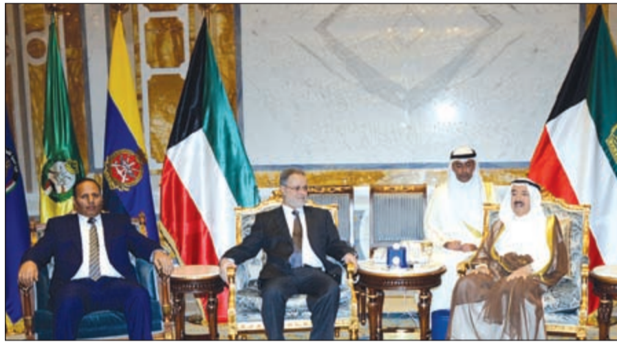
صاحب السمو الأمير خلال لقائه عبدالمك المخلافي

استقبل سمو ولي العهد الشيخ نواف الأحمد بقصر بيان صباح أمس سمو رئيس مجلس الوزراء الشيخ جابر المبارك واستقبل سموه نائب رئيس مجلس الوزراء ووزير الداخلية الشيخ محمد الخالد. كما استقبل سمو ولي العهد بقصر بيان صباح أمس نائب رئيس مجلس الوزراء ووزير الدفاع الشيخ خالد الجراح.