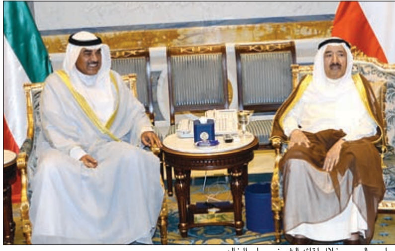
صاحب السمو خلال لقائه الشيخ صباح الخالد