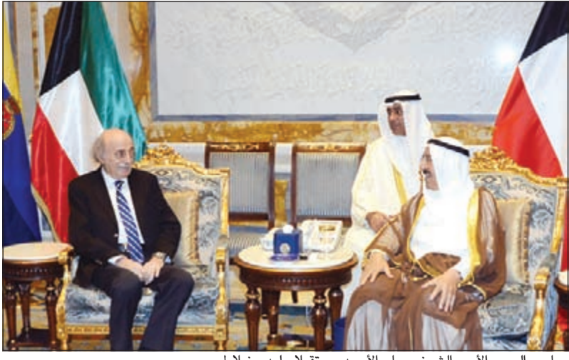
صاحب السمو الأمير الشيخ صباح الأحمد مستقبلاً وليد جنيلاط