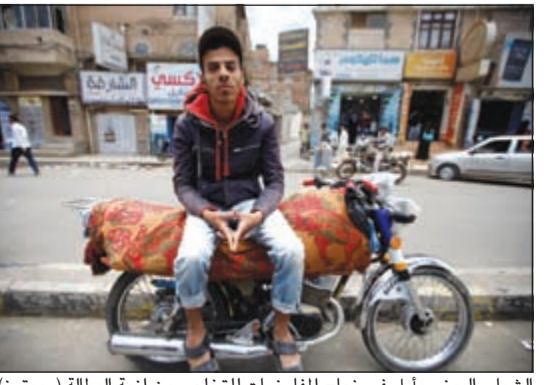
الشباب اليمني يأمل في نجاح المفاوضات للتخلص من أزمة البطالة

وأكدت مصادر محلية لـ«الأنباء» أن جميع محطات الوقود في العاصمة صنعاء أغلقت أبوابها بشكل مفاجئ مساء الاثنين في وجه المواطنين. من جانب آخر، قالت مصادر محلية وشهود عيان لـ«الأنباء»: «إن أكثر من 250 لاجئاً أفريقيا، أغلبهم صوماليون، عالقون حالياً بين العاصمة صنعاء ومحافظة الضالع جنوب اليمن بعد