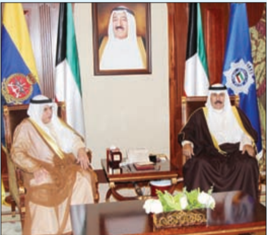
سمو ولي العهد الشيخ نواف الأحمد مستقبلاً الشيخ خالد الجراح

استقبل سمو ولي العهد الشيخ نواف الأحمد بقصر بيان صباح أمس سمو رئيس مجلس الوزراء الشيخ جابر المبارك واستقبل سموه نائب رئيس مجلس الوزراء ووزير الداخلية الشيخ محمد الخالد. كما استقبل سمو ولي العهد بقصر بيان صباح أمس نائب رئيس مجلس الوزراء ووزير الدفاع الشيخ خالد الجراح.