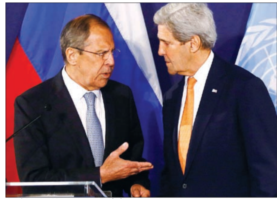
حور جانيبي بين وزير الخارجية الأميركي جون كيري والروسي سيرغي لافروف في ختام اجتماع مجموعة الدعم لسورية

وكان لافروف استنق الاجتماع بالدعوة إلى الضغط على المعارضة السورية لتحقيق التسوية في سورية