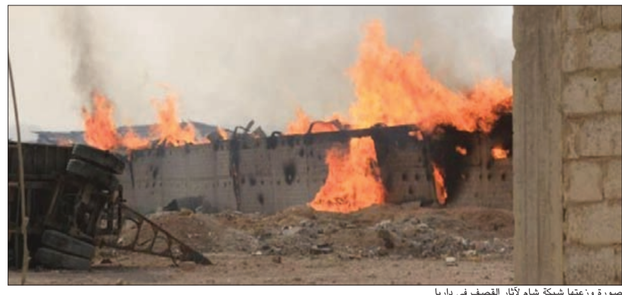
صورة وزعتها شبكة شام لأثار القصف في داريا