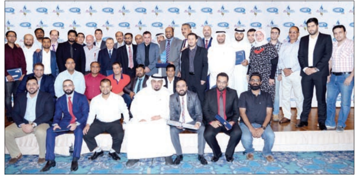
لقمة جماعية لموظفي الشركة

أمسية جميلة بعيدة عن الجو الرسمي للعمل وتم توزيع السروغ التذكارية والتقاط الصور بين الموظفين وقيادات الشركة. وقد تخلل الحفل العديد من الفقرات التي من ضمنها السحوبات على العديد من الجوائز القيمة ورحلات العمرة في شهر رمضان المبارك. وتحتفل كواليتي نت سنوياً بتكريم هذه الكوكبة من الموظفين المثاليين ممن أسهموا بشكل ملموس وفعال في تطوير أداء العمل داخل قطاعات الشركة والذين وضعوا نصب أعينهم تحقيق أهداف الشركة منذ إنطلاقها، ويأتي الحفل السنوي تقديراً وشكراً لكل منسوبي كواليتي نت في مختلف المواقع على