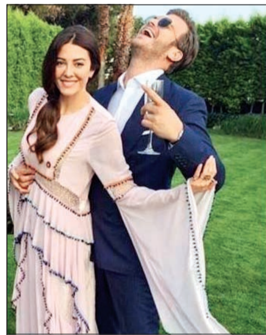
مهند يضحك ربما سخريه من فستان زوجته

الممثلة الكويتية نادى أرماس التي يطلقون عليها الفاتنة أثناء تواجدها في «كان».. حيث يعرض لها فيلمها الجديد «الأيدي الحجرية» ضمن المسابقة الرسمية. وعنه قالت: «بذلت فيه جهدا كبيرا وأتمنى أن يحظى بالإعجاب».