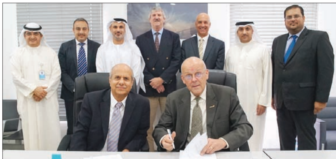
جانب من توقيع العقد