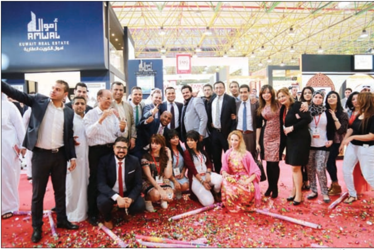
صورة جماعية لفريق «إسكان جلوبل» عقب نجاح المعرض

الأمن للاستثمار، كما كذبت هذه الدورة كذلك وجود أزمة في السوق العقاري. واستطرد قائلاً: جميع الشركات المشاركة في المعرض أبرمت العديد من الصفقات الضخمة التي فاقت قيمتها ملايين الدنانير، وأكدت في استبيان شاركت فيه جميع الشركات المشاركة في المعرض تحقيقها لأهدافها التسويقية وإبرامها لصفقات قوية جدت الثقة في العقار، واجمع الجميع على عدم وجود أزمة يعاني منها العقار، واجمعوا كذلك على أن الأزمة مفتعلة بامتياز، ولا توجد أزمة في السوق العقاري ولكن توجد مشكلة متمثلة في تناقل معلومات وتوقعات خاطئة ساهم الإعلام في انتشارها، مما أدى إلى خلق حالة من الضبابية والخوف، وأكد عقاريون إن تباطؤ نمو قطاعات اقتصادية وتدني أسعار النفط وتذبذب أسعار الذهب وعدم استقرار بعض أسواق المال والأسهم أدت إلى إشاعة توقعات وتنبؤات بتباطؤ نمو قطاع العقار وهو أمر غير صحيح بشكل حقيقي. وأضاف: كل الدلائل والمؤشرات تشير إلى محافظة القطاع العقاري على ريادته بين قطاعات الاقتصاد الوطني وبناء العقار كقيمة هامة تمثل ملاذاً آمناً يتمتع بالوقوة الكافية لمواجهة التحديات اللحظية التي قد تعكس آثارها غير المباشرة عليه.