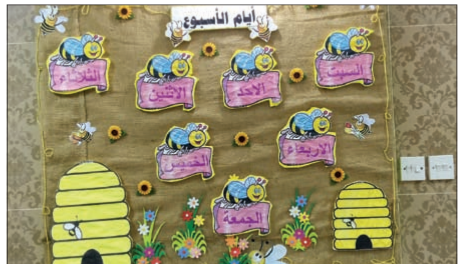
أيام الاسبوع من تصميم أحد النزلاء