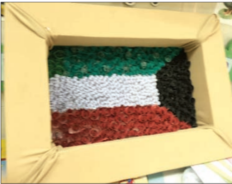
علم الكويت من تنفيذ أحد النزلاء

واوضح والد أحد المعاقين ان الرعاية التي يتلقاها الابناء الدار عبدالله عبدالسلام ان البنات يتسابقون في الإبداع والعمل والإتقان ونحرص على إشراكهم في كافة المعارض وورش حية ليطلع الجمهور على إبداعاتهم، حيث قام أحد الابناء برسم صورة لصاحب السمو الأمير وأخرى لسمو ولي العهد في أقل من اسبوع، وقام آخر برسم لوحة جميلة لعلم الكويت في أقل من يوم عمل.