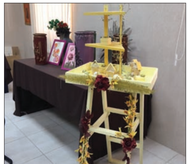
تصميمات والكسورارات راقية