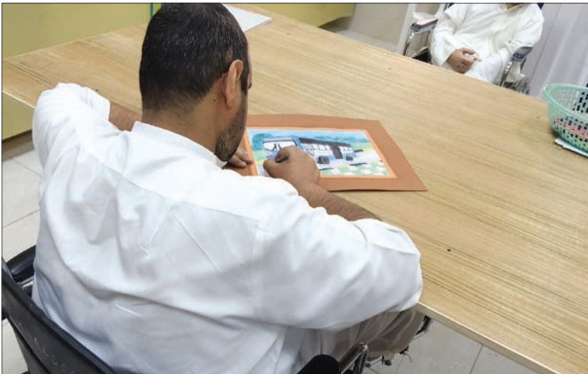
نزلة يمارس هوايته في الرسم