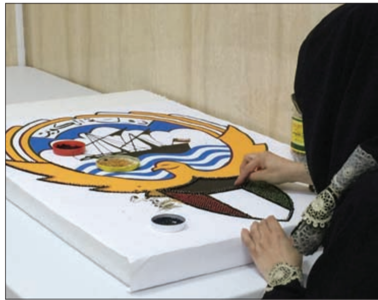
متدربة تقوم بتصميم شعار الكويت

من الورش في الدور وكانت المحطة الاولى في دور تأهيل الرجال وورش الرسم والخزف والأشغال اليدوية المتنوعة، حيث يتواجد 10 نزلاء في الوقت على أولياء الأمور، كما تعمل الإدارة على التوسع والتنوع في السورس، وهناك دراسة لاستفادة من مشغولات الأبناء عبر استبدال دروع التكريم بهدايا من مشغولاتهم اليدوية، لتشجيعهم على الإنتاج ويعود ثمن المشغولات للأبناء المنتجين وشراء مواد أولية والبداية، وجار العمل على اعداد دليل بالمنتجات يوزع على السمو الأمير وأخرى لسمو ولي العهد في أقل من اسبوع، وقام آخر برسم لوحة جميلة لعلم الكويت في أقل من يوم عمل.