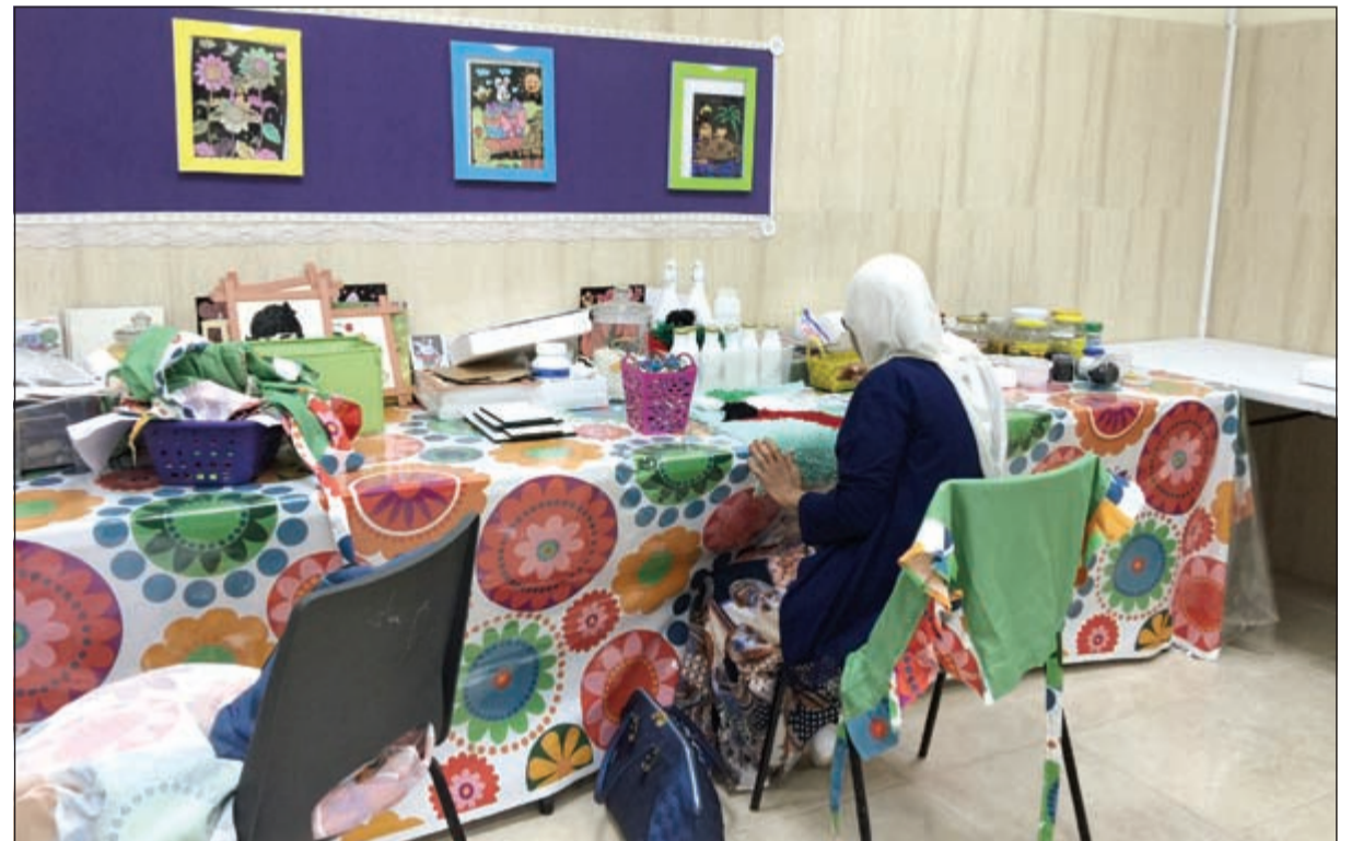
أحدى الورش التدريبية