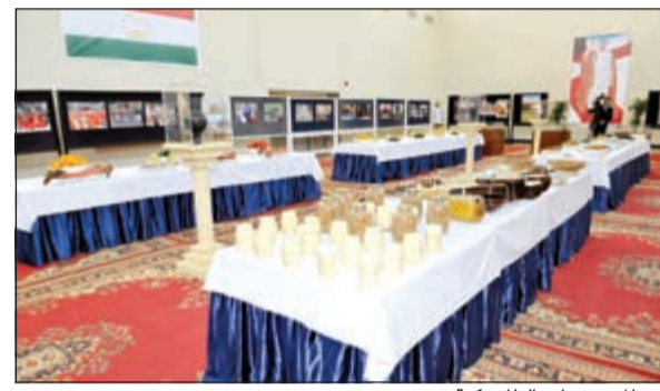
من العروض الطايجيكية

على الاعتزاز والإشادة بماضي شعبينا الشقيقين وقواسمهما المشتركة والوشائج الروحية والثقافية القائمة بينهما منذ مئات السنين، وفي هذا الصدد اقدم خالص التهاني للكويت حكومة وشعبا بمناسبة اختيارها عاصمة للثقافة الإسلامية، موضحا انه في مقدمة الكتاب تمت الإشارة إلى الشعب الطايجيكي يعد من أقدم شعوب آسيا الوسطى ومن منطلق ماضيها المشرف في صناعة الحضارة. وبين أن بلاده تستعد للاحتفال بالذكرى الخامسة والعشرين لاستقلالها الوطني وهذا ربيع العصر الأول لمساج حثيفة على مسيرة بناء دولة ذات سيادة وتعزيز السلام والاستقرار والوحدة والهوية والوطنية، قائلا: «اليوم تضي هذه الأمة بخطى ثابتة الى مستقبل مشرق بالعزيمة والإرادة القوية والأهداف النبيلة وفي هذا الدرب يستلهم الشعب الطايجيكي من ماضيه المجيد ومن إنجازات