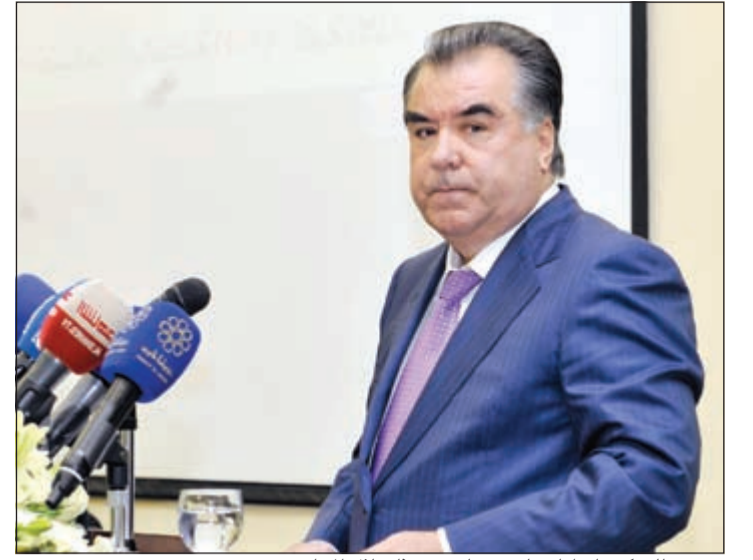
رئيس طايجيستان امام علي رحمان متحدثا خلال المحاضرة