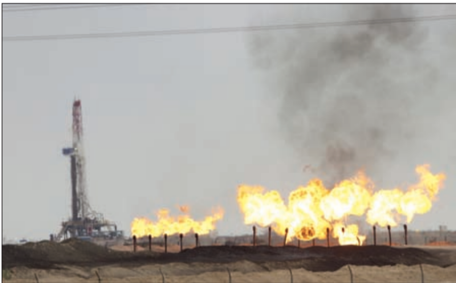
ارتفاع المتوسط الشهري لأسعار أوبك للشهر الثالث على التوالي خلال شهر أبريل بنسبة 9,3%

على التوالي خلال شهر أبريل بنسبة 9,3% ليصل إلى 37,86 دولارا للبرميل، وهو يعد أعلى معدل شهري يسجله سعر أوبك منذ شهر نوفمبر 2015. كما ارتفع المتوسط الشهري لسعر برميل النفط الكويتي بنسبة 10,1% ليصل إلى 36,3 دولارا للبرميل بحلول نهاية الشهر، في حين تجاوز متوسط أسعار خام برنت مستوى 40 دولارا للبرميل للمرة الأولى منذ شهر نوفمبر الماضي حيث ارتفع بنسبة 8,8% ليصل إلى 41,58 دولارا للبرميل. أما من ناحية معدل الإنتاج الشهري، فذكرت وكالة بلومبيرغ أن معدل الإنتاج النفطي للدول الأعضاء في منظمة الأوبك قد ارتفع بعد شهرين متتاليين من التراجع، بنسبة 1,5% خلال شهر أبريل أو ما يوازي 484 ألف برميل يوميا ليصل إلى 33,22 مليون برميل يوميا بالمقارنة مع 32,73 مليون برميل يوميا خلال شهر مارس. وقد قامت أكبر أربع دول منتجة للنفط في منظمة الأوبك وهي المملكة العربية السعودية، وإيران، والعراق، والإمارات بزيادة إنتاجها النفطي خلال شهر أبريل في حين انخفض الإنتاج النفطي للكويت بسبب إضراب عمال قطاع النفط، إضافة إلى تراجع الإنتاج النفطي في نيجيريا بسبب تعطل الإنتاج في خطوط أنابيب النفط. وقد سجلت إيران أعلى نسبة نمو في إنتاج النفط خلال شهر أبريل بعد أن رفعت إنتاجها النفطي بمعدل 300 ألف برميل يوميا في محاولة لبلوغ مستويات ما قبل فرض العقوبات، كما ارتفع معدل الإنتاج النفطي في العراق بنحو 160 ألف برميل يوميا تلاه زيادة بمعدل 80 ألف برميل يوميا في الإنتاج النفطي في السعودية و60 ألف برميل يوميا في دولة الإمارات.