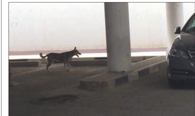
كلب ضال يرتع في الجامعة

تحول موقع جامعة الكويت في الشويخ إلى مرتع للكلاب الضالة التي أصبحت تتجول داخلها بكل حرية، في منظر أثار استياء الطلبة والأساتذة والعمال. فقد فوجئ الجميع بأعداد من الكلاب تتجول ضمن مجموعات أو بمفردها، وهو ما جعل بعض الطلبة وخاصة الطالبات يتجنبون المرور بالقرب منها، خوفا من التعرض لهجمات والتي قد تكون مريضة أو مصابة. وأكد عدد من الطلبة لـ«الانباء» أن ظاهرة تجول الكلاب داخل الجامعة أصبحت منتشرة، مطالبين بضرورة التدخل من أجل القضاء عليها ومنع دخولها الى المكان وهو الحرم الجامعي. وعبروا عن قلقهم من انتشار الكلاب الضالة وما تحمله من خطر يهددهم في الحرم الجامعي، مبدئين مخاوفهم من أن تحمل تلك الحيوانات أمراضا وأذى لهم، مناشدين إدارة الجامعة سرعة التدخل لحماية مداخل ومخارج مباني الحرم الجامعي حتى لا تتسلسل مثل هذه الحيوانات الى الداخل.