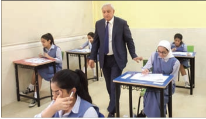
جانب من جولة الوزير العيسى في إحدى لجان الطالبات