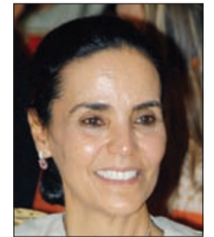
الشبيخة أمثال الأحمد

قامت رئيسة مركز الكويت للعمل التطوعي الشبيخة أمثال الأحمد بزيارة تفقدية