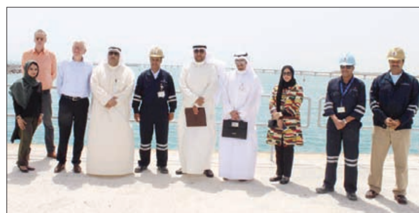
فريق المتابعة في مقر مشروع مصفاة الزور

المصفاة الجديدة في منطقة الزور يعد أضخم المشاريع التي تضطلع بتنفيذها شركة البترول الوطنية الكويتية وهو من أضخم المشاريع الاستراتيجية في الكويت. وأشار إلى أنه من المقرر أن تبلغ طاقة المصفاة 615 ألف برميل يوميا، لافتاً إلى أن الهدف من المشروع هو تلبية الطلب المتزايد لمحطات توليد الطاقة من زيت الوقود ذي المحتوى الكبريتي المنخفض حيث سيتم بناء المصفاة طبقاً لأحدث التقنيات والنظم الصناعية المستخدمة في صناعة تكرير النفط الخام، كما روعي فيه أعلى مستويات أنظمة السلامة والصحة والبيئة، ولفت المطيري إلى أنه تزامن مع زيارة وفد أمانة التخطيط لموقع المشروع بمشاركة احتفالات مؤسسة البترول الكويتية بافتتاح طريق جديد (عن طريق البحر) لنقل المعدات من منطقة الشبيخة إلى موقع المشروع اختصاراً للوقت والجهد.