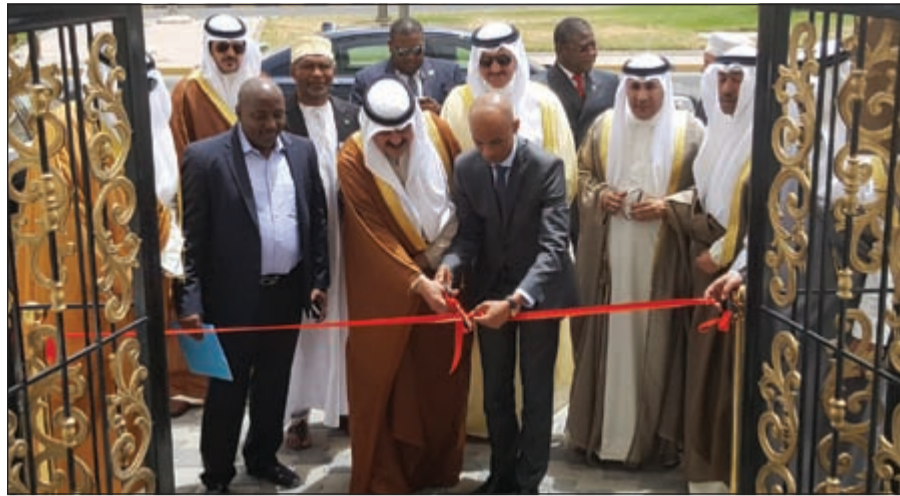
خالد الجارالله خلال افتتاح سفارة جزر القمر

وأضاف ان افتتاح هذه السفارة يأتي لتعزيز العلاقات وتبادل الخبرات في شتى المجالات وبناء أسس التعاون الثنائي كما سنسهم في توطيد العلاقات القائمة على الصداقة. وأشار الى ان العلاقات تعكس قدرا غير مسبوق للتنسيق والتشاور السياسي وهي تزداد نموا يوما بعد يوم، معربا عن شكره للمواقف الكويتية الداعمة لجزر القمر في كافة المجالات. بدوره قال سفير جزر القمر المتحدثة لدى الكويت د. العارف سيد حسن نرحب بكم انها مناسبة عظيمة ان نلتقي في الكويت ارض السلام والمحبة لافتتاح سفارتنا في الكويت، وتعيين سفير مقيم فيها، مثنيا على جهود صاحب السمو الامير الشيخ صباح الاحمد، لوقوفه مع القرم المتحدة والتشاور المستمر مع الرئيس. وأضاف ان هذه العلاقات التاريخية المتطورة ما كانت لتستمر لولا جهود ويزري الخارجية في البلدين، موضحا ان هذه المناسبة هي فرصة ذهبية للتعبير عن التقدير والاعتزاز بعلاقات الاخوة بين الشعبين والقيادات لدى البلدين، وتطور الدفق بالعلاقات على كافة المستويات، هذه العلاقة تاريخية وازلية وتعاون منفر قائم بين البلدين.