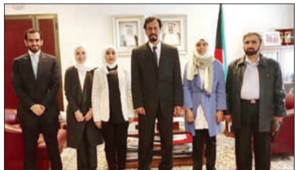
الشيخ علي خالد مع الوفد الإعلامي الثقافي الكويتي برئاسة الشبيخة رشيا نايف الجابر

محالات حفظ الوثائق والمؤلفات وتصنيفها وصيانتها وترميمها وتأمين من مخاطر الضياع والتلف. من جانبها توجهت الشبيخة رشيا نايف الجابر الصباح واعضاء الوفد بالشكر والامتنان الى سفير الكويت الشيخ علي خالد الجابر الصباح واعضاء السفارة على التنظيم الممتاز وتوفير كل أسباب انجاح مهمة الوفد لدى الجهات الإيطالية التي أبدت رغبة وحرصا واضحين للتعاون والمساهمة في تعزيز العلاقات الكويتية - الإيطالية الممتازة.