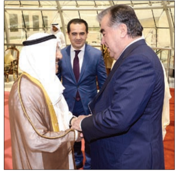
صاحب السمو الأمير الشيخ صباح الأحمد خلال استقباله الرئيس امام علي رحمان رئيس طاجيكستان

صاحب السمو وإمام علي رحمان بحثا العلاقات الثنائية بين البلدين وسبل تعزيزها وتنميتها في مختلف المجالات