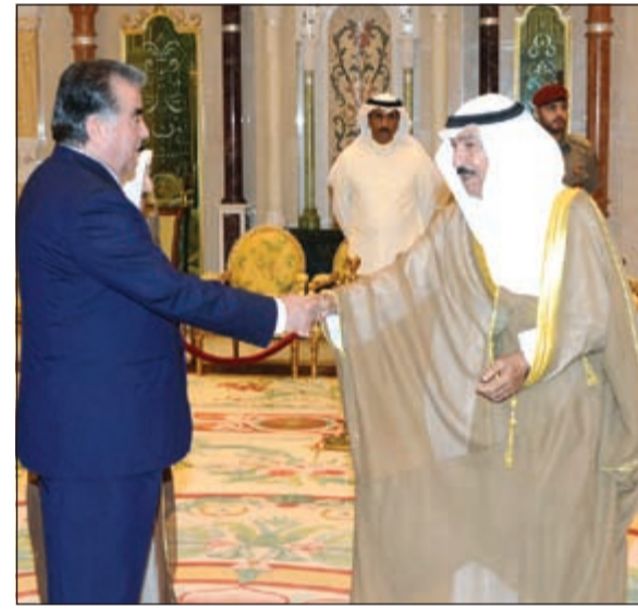
رئيس طاجيكستان مصافحا الشيخ جابر العبدالله