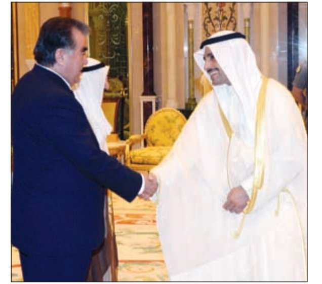
الرئيس امام علي رحمان مصافحا مرزوق الغانم

وقد عقدت المباحثات الرسمية بين الجانبين وترأس الجانب الكويتي صاحب السمو الأمير وسمو ولي العهد ورئيس مجلس الوزراء بالإنيابة ووزير الخارجية الشيخ صباح الخالد وكبار المسؤولين بالدولة، وعن الجانب الطاجيكي الرئيس امام علي رحمان رئيس جمهورية طاجيكستان وكبار المسؤولين في الحكومة الطاجيكية. وقد صرح نائب وزير شؤون الديوان الأميري الشيخ علي الجراح بأن المباحثات تناولت العلاقات الثنائية بين البلدين والشعبين الصديقين وسبل تعزيزها وتنميتها في مختلف المجالات وتوسيع أطر التعاون بين الكويت وجمهورية طاجيكستان بما يخدم مصالحهما المشتركة وأهم القضايا ذات الاهتمام المشترك.