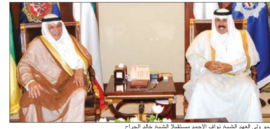
سمو ولي العهد الشيخ نواف الأحمد مستقبلاً الشيخ خالد الجراح

استقبل سمو ولي العهد الشيخ نواف الأحمد بقصر بيان صباح امس رئيس مجلس الأمة مرزوق الغانم. واستقبل سموه بقصر بيان صباح امس رئيس مجلس الوزراء بالإنيابة ووزير الخارجية الشيخ صباح الخالد. كما استقبل سمو ولي العهد بقصر بيان صباح امس نائب رئيس مجلس الوزراء ووزير الداخلية الشيخ محمد الخالد. واستقبل سمو ولي العهد بقصر بيان امس نائب رئيس مجلس الوزراء ووزير الدفاع الشيخ خالد الجراح. واستقبل سموه بقصر بيان امس نائب رئيس مجلس الوزراء ووزير المالية ووزير النفط بالوكالة أنس الصالح. كما استقبل سمو ولي العهد الشيخ نواف الأحمد بقصر بيان امس وزير الدولة لشؤون مجلس الوزراء الشيخ محمد العبدالله.