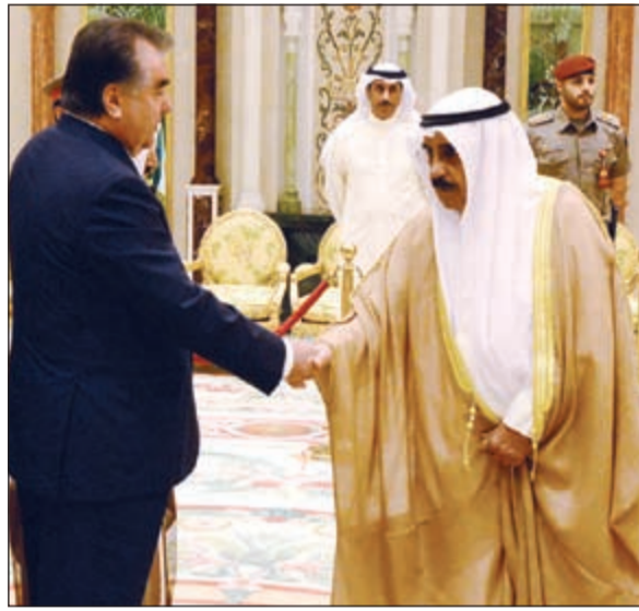
الشيخ فيصل السعود مصافحا رئيس طاجيكستان