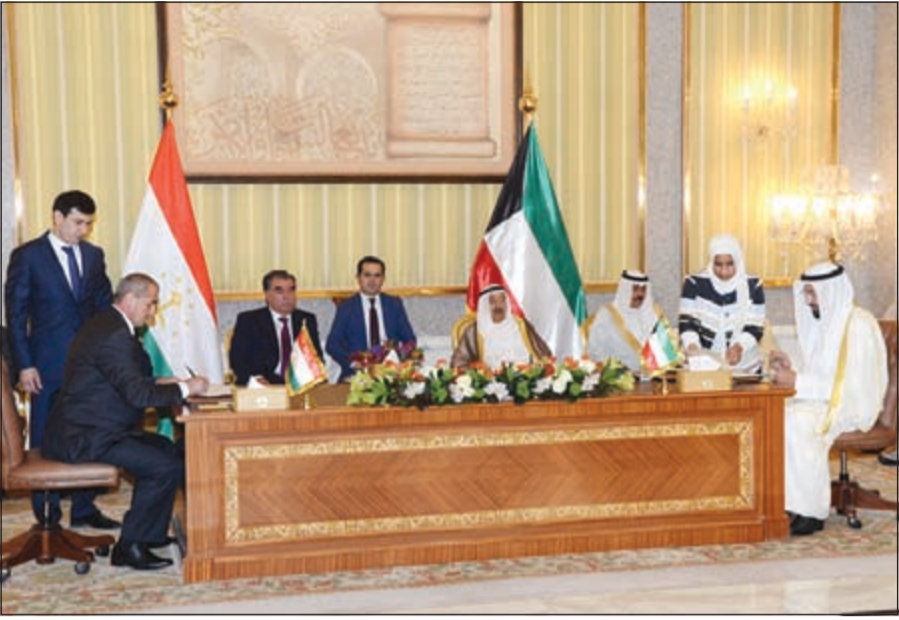
توقيع جانب من الاتفاقيات بحضور صاحب السمو الأمير الشيخ صباح الأحمد والرئيس امام علي رحمان رئيس طاجيكستان