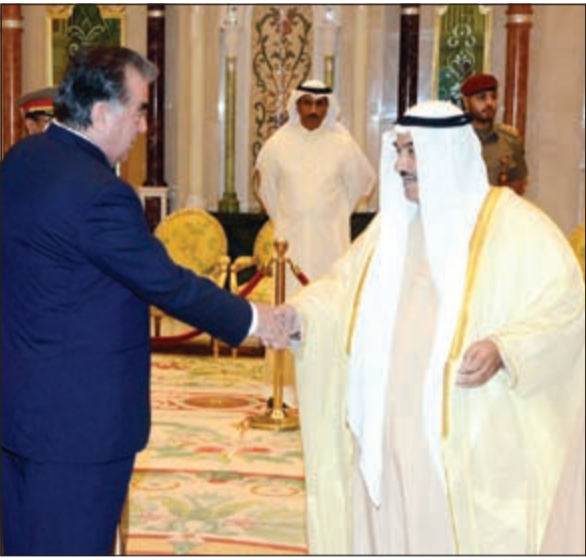
الرئيس امام علي رحمان وسمو الشيخ ناصر المحمد