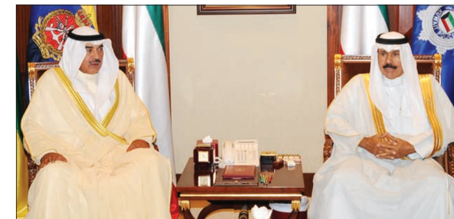
سمو ولي العهد الشيخ نواف الأحمد مستقبلاً الشيخ صباح الخالد