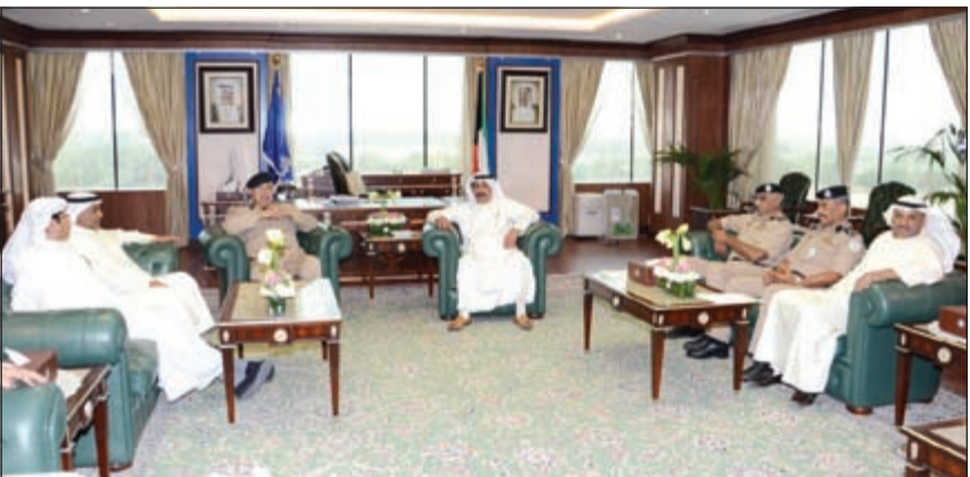
الفريق سليمان الفهد خلال الاجتماع مع عدد من قيادات الداخلية والجمارك

ان يضعوا امس الكويت امام عيونهم من خلال الجدية والمخابرة في العمل. وأكد وكيل وزارة الداخلية أهمية اصلاح أي خلل في هذه المنافذ من خلال التعاون والتنسيق بين الجمارك والأجهزة الأمنية. من جانبهم أعرب مسؤولو الجمارك عن شكرهم لوزارة الداخلية لتعاونها وتنسيقها مع رجال الجمارك.