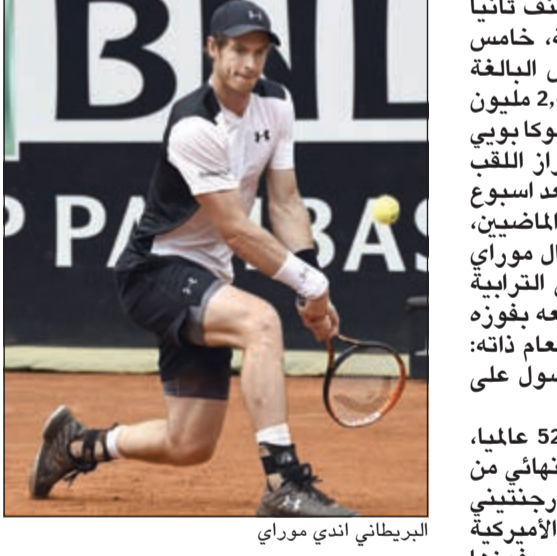
البريطاني اندي موراي

بلغ البريطاني اندي موراي المصنف ثانيا بسهولة نهائي دورة روما المختلطة، خامس دورات الماسترز للألف نقطة للتنس البالغة جوائزها 4,3 ملايين يورو للرجال و2,4 مليون يورو للسيدات، بفوزه على الفرنسي لوكا بوبي يوم عيد ميلاده التاسع والعشرين، بعد اسبوع من فوز ديوكوفيتش، بطل العامين الماضيين، عليه في نهائي دورة مدريد. وقال موراي الذي احرز أول لقب على الأراضي الترابية في ميونخ في ابريل 2015 ثم اتبعه بفوزه الأول في الماسترز في مدريد في العام ذاته: «أرغب في الفوز في النهائي والحصول على لقب آخر في الماسترز».