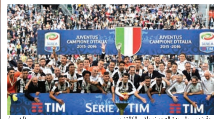
فرحة نجوم «السيدة العجوز» بلقب الكالتشيو