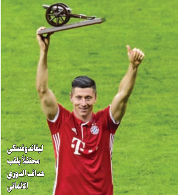
ليفاندوفسكي متخطيا لقب صانف التوري الألماني