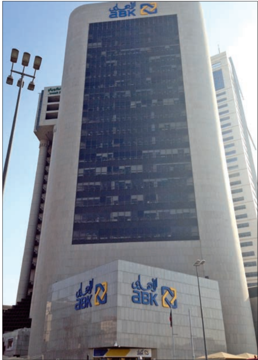
مبنى البنك الأهلي الرئيسي

الأول من عام 2016، وهي خطوة إضافية للامام لوضع اسم البنك الأهلي الكويتي في مصاف البنوك الرائدة في مصر والمنطقة.