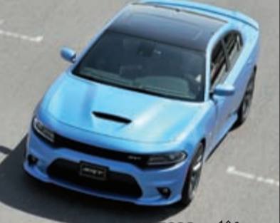
دودج تشارجر 392 SRT

الصمامات، هذا المحرك بولد قوة تصل إلى 485 حصانا، وعزم دوران هائل يقدر بـ 944 نيوتن متر، ويتصل المحرك بناقل حركة أوتوماتيكي تورك فلايت من 8 سرعات، هذه المنظومة الميكانيكية تتسارع بالسيارة من السكون إلى سرعة 100 كلم/س في غضون 4.8 ثوان أما السرعة القصوى فهي محددة إلكترونيا بـ 280 كلم/س، ولزويد من الاداء الرياضي قامت SRT بتزويد تشارجر بمكابح قرصية مانعة للانغلاق على العجلات الـ 4 مع مجموعة من مكابح بريميمو