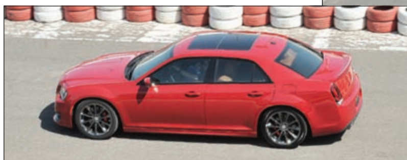
كرايسلر 300 SRT

جيب غراند شيروكي «SRT» هي ليست سيارة متعددة الاستعمالات فحسب، إنها سيارة رياضية خالصة، جيب غراند شيروكي «SRT» وجدت لتنافس سيارات هذه الفئة القادمة من القارة الأوروبية، هنا نجد أداء مفعم بالقوة بقدرات جبارة وأناقة التصميم بسعر منافس، SRT قامت بتزويد غراند شيروكي بمحرك مستعار من كرايسلر 300 SRT، وبذات ناقل الحركة مع فارق الاندفاع الرباعي في جيب، أرقام الأداء تختلف فالتسارع من السكون إلى 100 كلم/س يتم في غضون 4.8 ثوان، أما السرعة القصوى فهي 256 كلم/س.