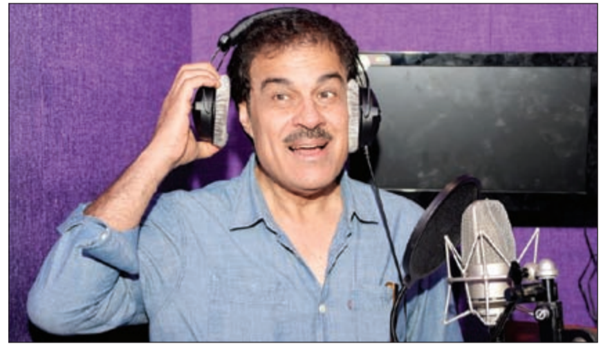
الحربي أثناء تسجيل صوت «الراوي»

صدق ما قاله المنتج بندر طلال السعيد، في المؤتمر الصحافي الذي عقده في الفترة القليلة الماضية للإعلان عن تفاصيل مسرحيته الجديدة «البيدار»، حيث أكد أن المسرحية ستشهد مفاجأة من خلال صوت «الراوي» الذي سيتصدى له نجم كبير، حيث فرغ الفنان القدير إبراهيم الحربي من تسجيل دوره في مسرحية «البيدار» وتحديد شخصيته «الراوي»، ليُسجل حضورا مميزا رغم غيابه عن المشاركة ممثلا على الخشبة.