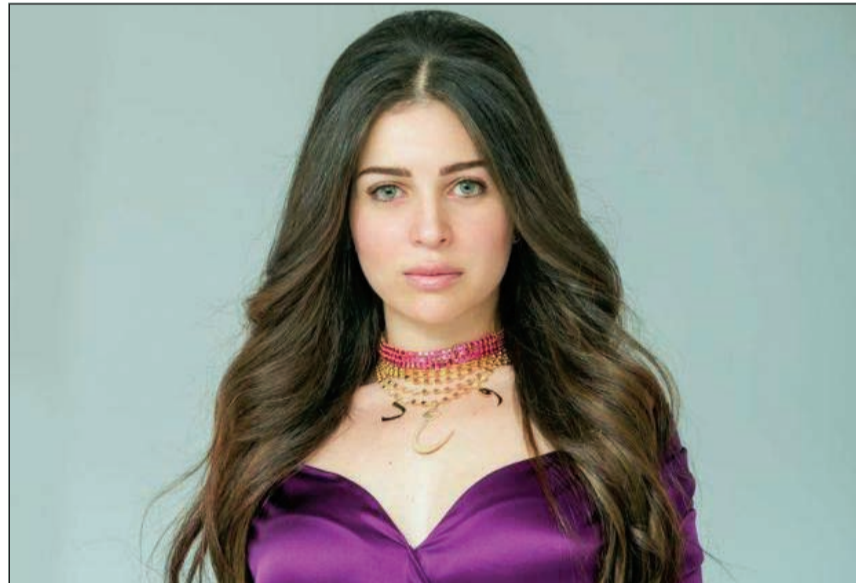
مي عز الدين

في أول تعليق منها حول اتهامها بالخضوع لعمليات تجميل، قالت النجمة المصرية مي عز الدين، إنها لم تقم بإجراء أي عمليات تجميل وإن كنت دائما تفكر في إجراء تجميل وتعديل شكل أنفها لكن كل المحيطين منها يحذرونها من ذلك ولهذا لا تقم بأي عملية تجميل.