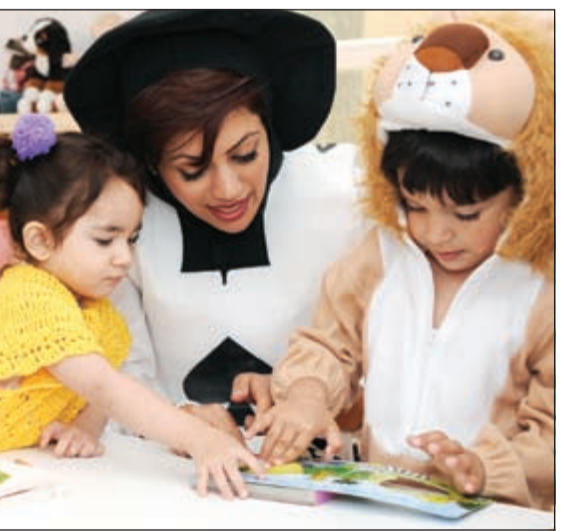
الأطفال يستمتعون بالقراءة