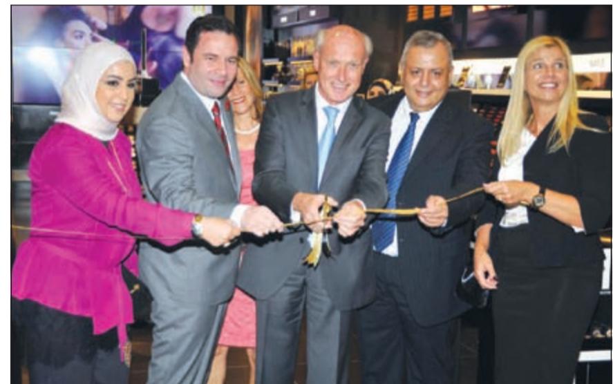
السفير الهولندي فرانس بوتيت يقص شريط الافتتاح (أنور الكندري)