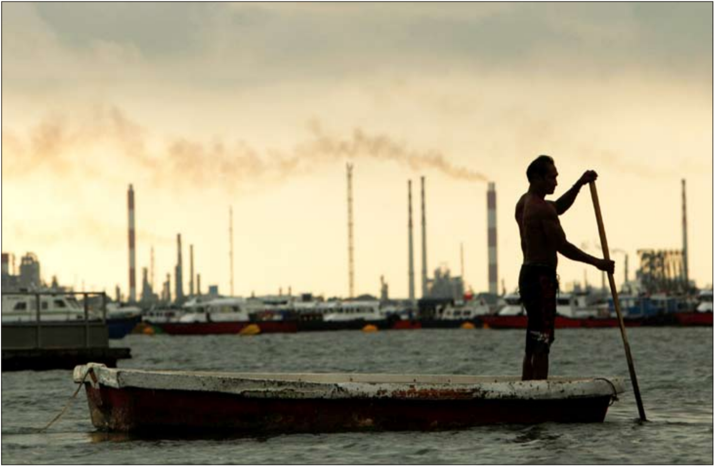
صياد يمر أمام مصفاة نفط في سنغافورة.. وقد أدى عدم الاتفاق على تثبيت الإنتاج في أبريل الماضي إلى ارتفاع إنتاج «أوبك» إلى أعلى مستوى منذ 2008

لأنها ليست عضواً في هذه المنظمة - ومن غير المحتمل أن تشارك في القمة القادمة المقررة في الثاني من يونيو.