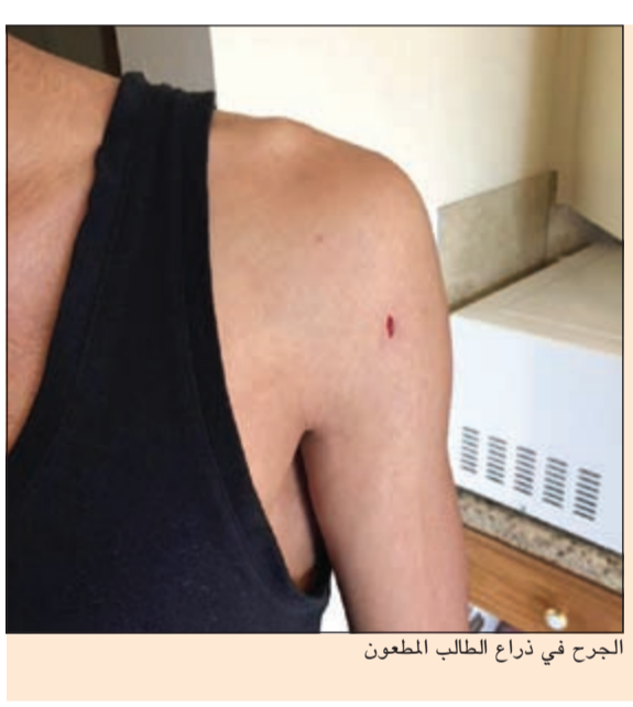
الجرح في ذراع الطالب المطعون