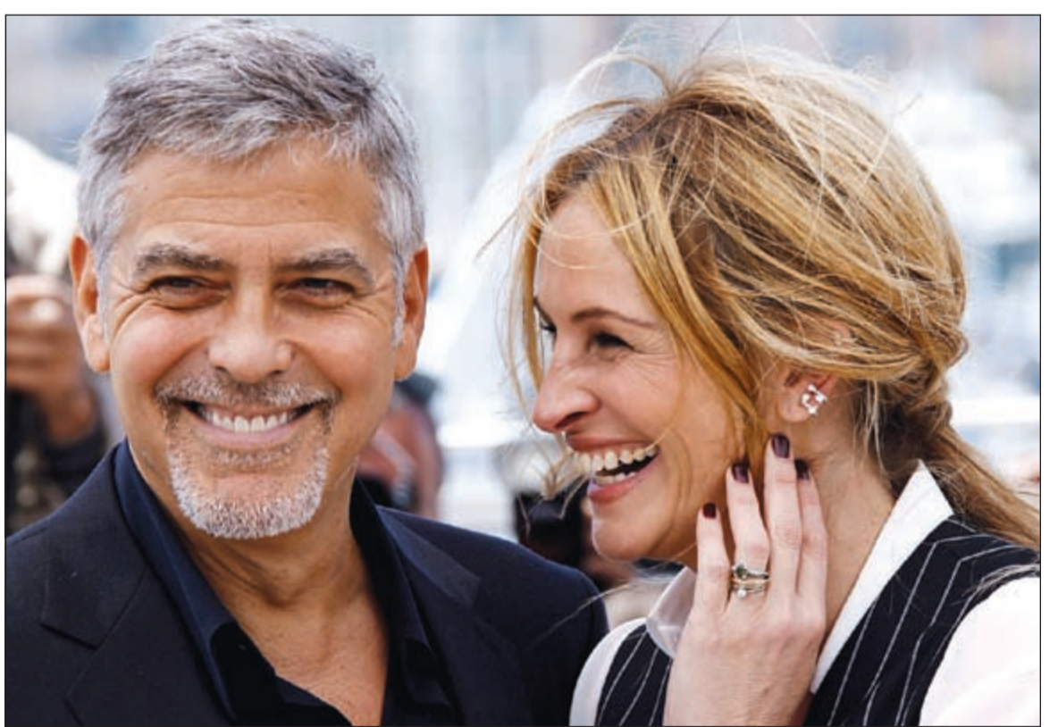
جوليا روبرتس وكولوني في «كان»

الأخرى في الثاني والعشرين من مايو إثر المسابقة الرسمية التي يشارك فيها هذه السنة 21 قفلا من 14 بلدا. وقد تعهد وزير الداخلية الفرنسي برنار كان بوف «بتعبئة استثنائية» لضمان أمن الحدث، مشيرا إلى أن «الخطر الأمني أكبر من أي وقت مضى». وتشمل الترتيبات الأمنية نشر مئات من عناصر الشرطة وفريق من خبراء المتفجرات و400 حارس أمني خاص وسبعة سباحين منفذين،