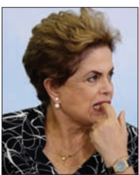
الرئيسة المعزولة ديلا روسيف

برازيليا - وكالات: تحولت ديلا روسيف «سيدة البرازيل الحديدية» من معتقلة ومناضلة ضد النظام العسكري الديكتاتوري إلى «رئيسة معزولة»، بعد أن أيدت أغلبية أعضاء مجلس الشيوخ تعليق مهامها لستة أشهر تهنيداً لإقالتها، لينتهي بذلك 13 عاماً من حكم اليسار. وهو ما اعتبرته روسيف في أول تعليق لها على حسابها على موقع فيسبوك بأنه «انقلاب». كما أيد مجلس الشيوخ أيضاً محاكمة خليفة