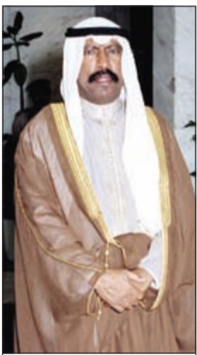
سمو الأمير الوالد الراحل الشيخ سعد العبدالله

8 أعوام على رحيل سمو الأمير الوالد سعد العبدالله.. فارس التحرير باق في القلوب