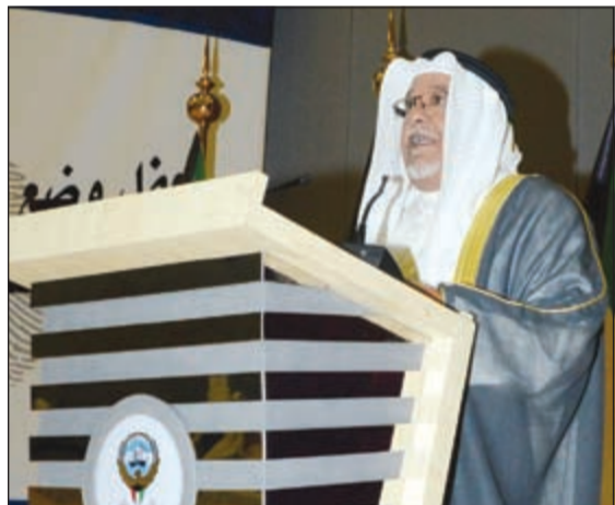
نائب وزير الديوان الأميري الشيخ علي الجراح يلقي كلمته